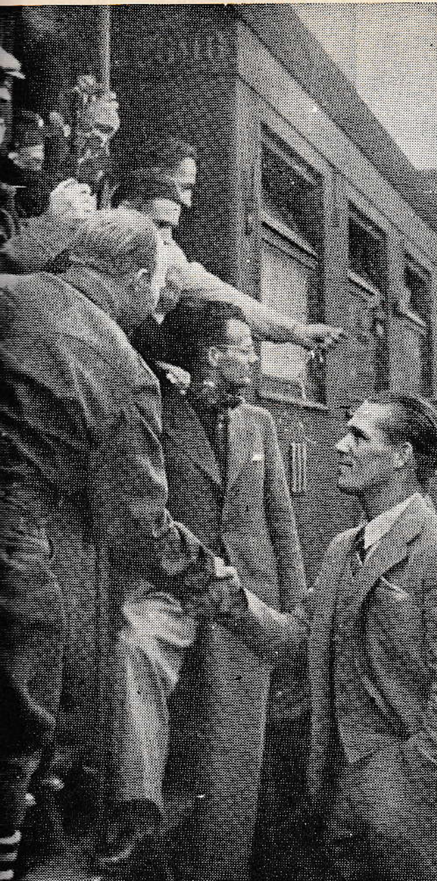
Amerikan suomalaiset vapaaehtoiset lähössä Helsingin asemalla paluumatkalle.