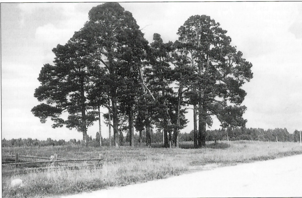
Pyhä lehto Birtšövan kylässä.

Tihvinän karjalaisilta tallennetut perimätiedot vahvistavat ja täydentävät Käkisalmen läänin karjalaisten muuttoa koskevaa historiallista informaatiota. Ne valaisevat tämän etnisen ryhmän joitakin vaiheita. Tarinat kertovat siitä, missä tämä ryhmä asui aikaisemmin, miksi ja milloin se joutui jättämään oman seutunsa. Perimätieto säilyttää myös muiston tämän alueen ensimmäisistä asukkaista ja kylistä.