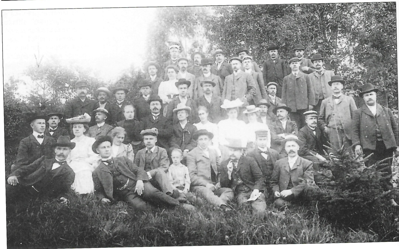
Vienan Karjalaisten Liiton perustavan kokouksen osanottajat Tampereella elokuussa 1906.