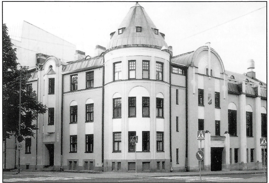
Kun Karjalan Sivistysseura perustettiin v. 1917, kokous pidettiin VPK:n talossa.