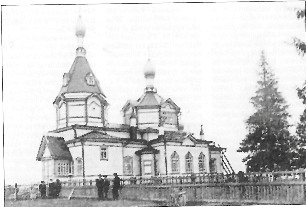
Salmin Orusjärven kirkko viime vuosisadan alussa.

Tutustuin monipuolisesti seutukunnan elämään. Kansa eli alkuperäistä elämäänsä. Ja kun puhumme Vieljärven oloista, kuvastavat ne tarkalleen toisten rajantakalaisten kylien oloja. Kansa oli säilyttänyt kielen, jota se puhui aina kotoisissa oloissaan. Jos oli karjalaissyntyinen pappi, niin hän saarnasi silloin tällöin karjalaksi, mutta venäläinen ummikko pappi ei kyennyt mitään antamaan. Kansan tavat olivat alkuperäiset; siiveellinen elämäntaso oli korkealla, joka johtui karjalaisten ikivanhoista katsoimuksista, ehkä uskonnosta-kin,