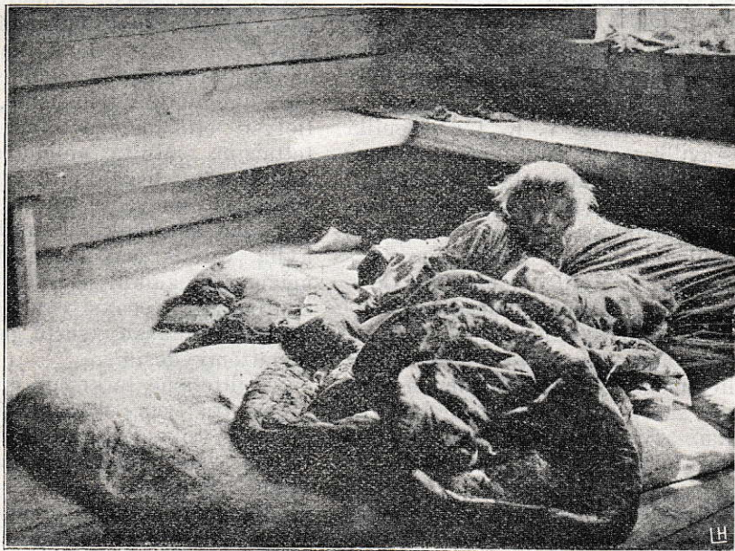
Kuvia Vienan Karjalasta: Lapsia vuoteella.

Vieras riisti rintalasna, Eksytti emon sylistä, Heitti suin sulahan suohon Karhujen kotosijoille.