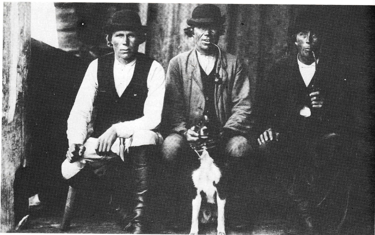
Vornasten veljekset Korpiselän Tolvajärveltä (I.K. Inha 1893, Museovirasto).

Yksi Annin vaikuttavimmista ja upeimmista runoista on Härkösen kokoelmaan sisältyvä rekryyttirunokooste Sotaan lähtijän virsi; se on kuin Annin hyvästijättö.