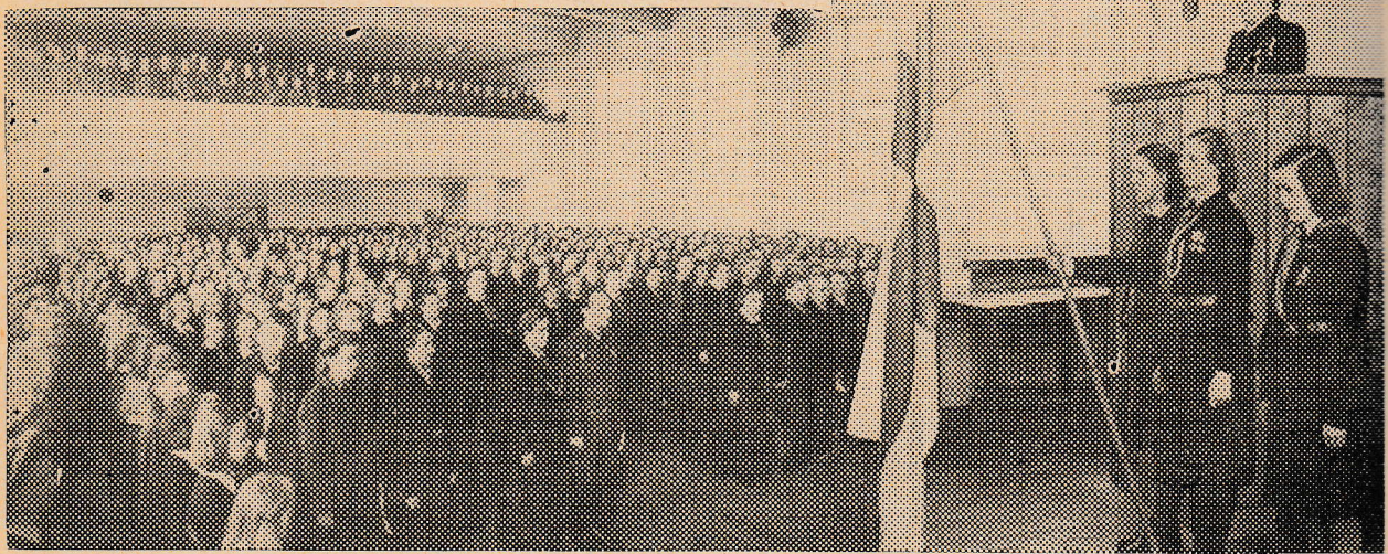
Partiotytöt talvipäivillä. Osanottajia n. 700.