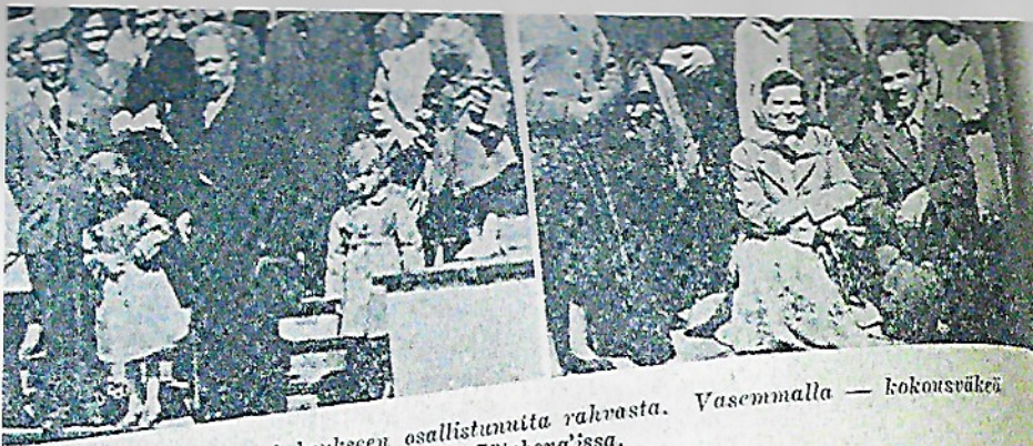
sen jälkeen karjalaisten kokoukseen osallistuneita rahvasta. Vasemmalla — kokousväkeä Borås'issa ja oikealla Göteborg'issa.