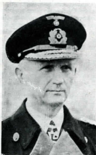
Suoramiraali Dönitz, jonka käskystä saksalaiset laskivat aseensa.