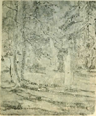
Wille Boijer-Poijärvi: Metsässä.