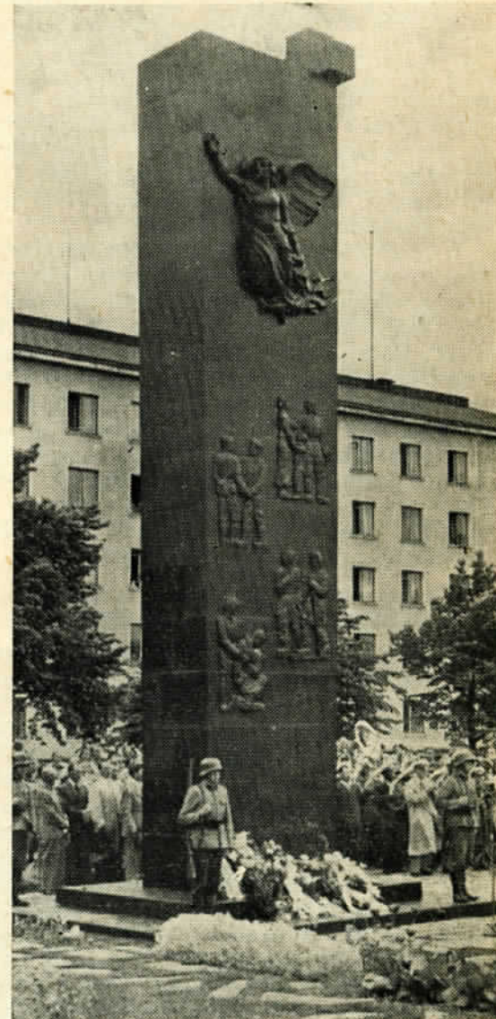
Kotkan sankaripatsaan paljastusjuhlaa vietettiin heinäk. 1 p:nä kirkkopuistikossa.