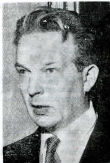
Prof. Matti Kuusi.