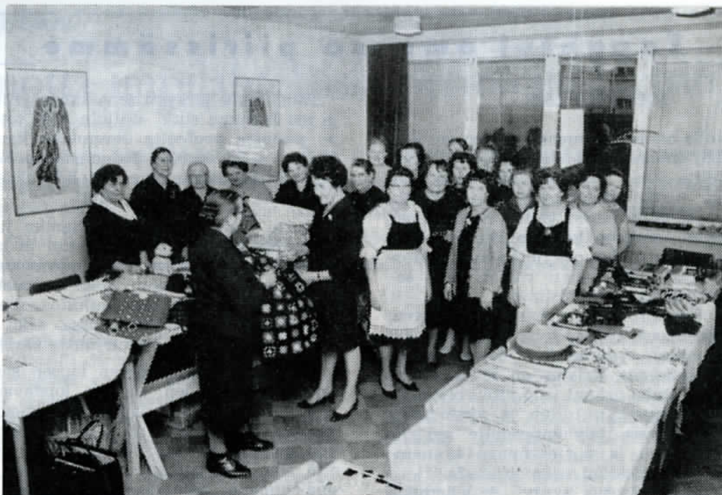
Karjalaiset myyjäiset Helsingissä itsenäisyyspäivänä 6. 12. -68. Kuvassa järjestäjäseurojen: Pääkaupungin impilahtelaisten, Helsingin suojärveläisten seuran ja Karjalan Sivistysseuran innokkaita myyjättäriä.