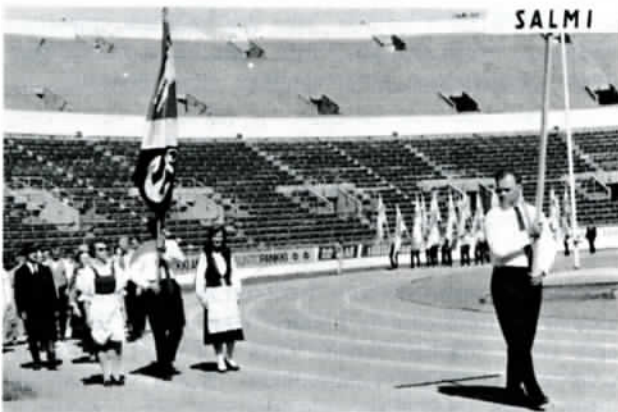
Salmilaiset karjalaisten suurjuhlassa 1970.