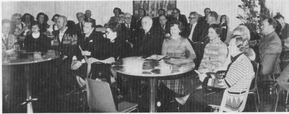
KL:n Pohjolan karjalaisseurapiirin vuosikokouksen osanottajia Sotkamossa 1. 2. -80.

KÄÄPÄ OY on saavuttanut 140 vuoden iän. Karjalan Kannaksella toimintansa aloittanut yritys on Pohjoismaiden vanhin saman suvun hallussa oleva kauppahuone. Tällä hetkellä perheyrittäjien johdossa on viides sukupolvi.