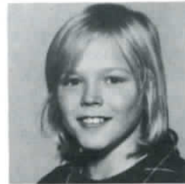
Kuva 2. Tunnetko tämän hymyilevän pojan? Nyt on jo kasvanut voimamieheksi, kyykkäennätys +27.