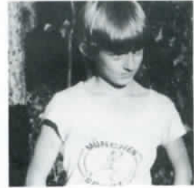
Kuva 3. Sauva lentää hyvin. Isäkin saa tunnustaa joskus häviönsä. Tunnetko hänet?