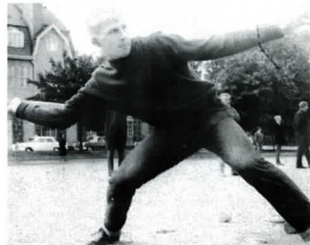
Kuva 4. Kuusitoistavuotiaana (1966) lyöjä voitti KSS:n karsinnat pääsystä SM-kilpaan. Ennätys +24. Kuka hän on?