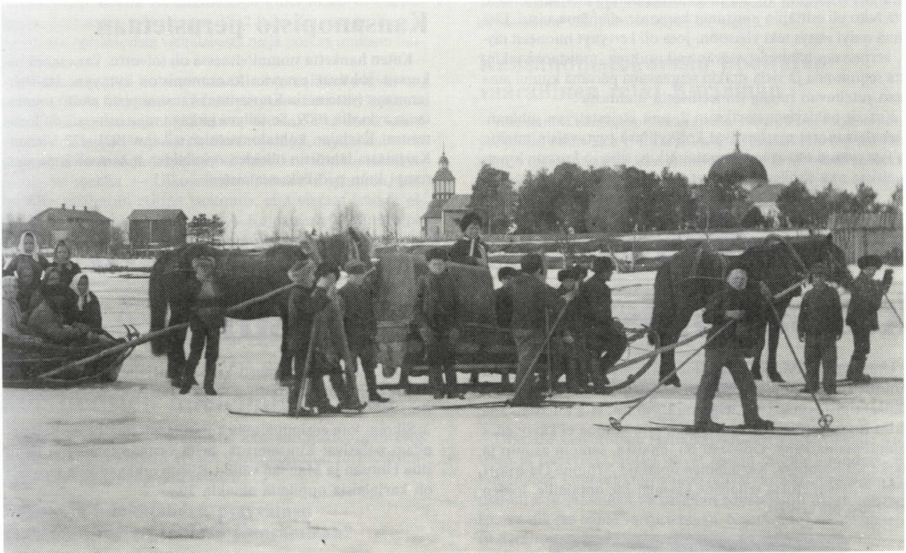
Vienankarjalaista nuorisoa saapumassa Kuusamon ensimmäisille kansanopistokursseille kevähangilla 1908. Taustalla pitäjän vanha kirkko.