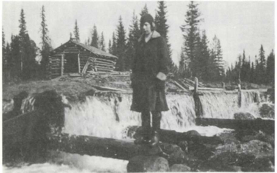
Mellitsän kohdalla vesi ryöppysi padon yli ruuheen.