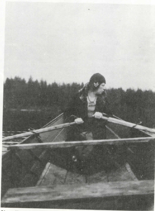
Vene lipui hiljalleen Kuivajärven tyyntä pintaa.