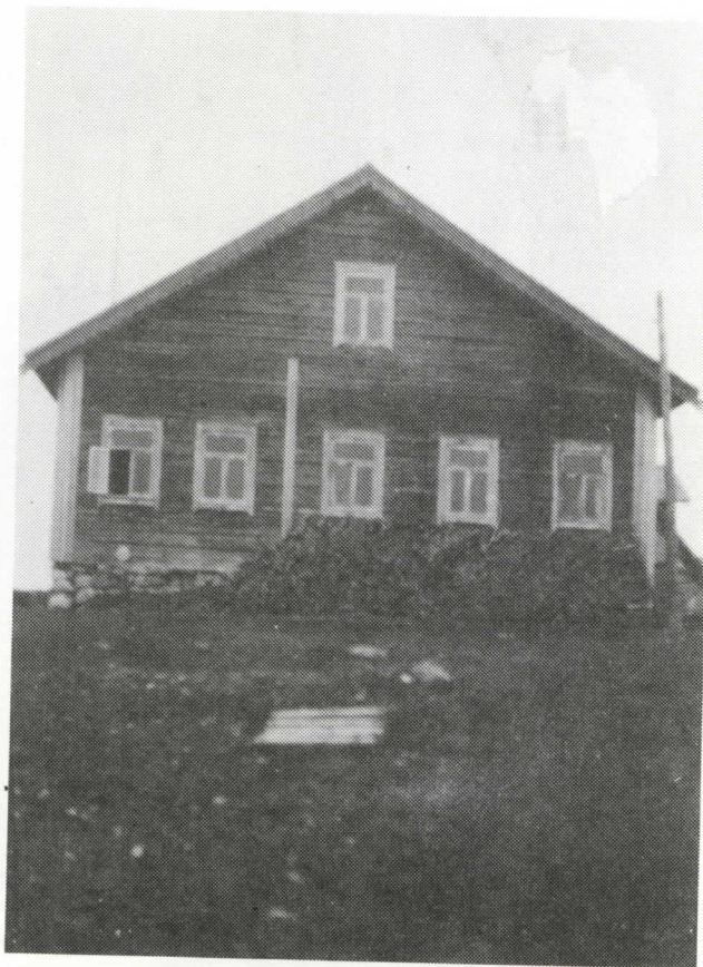
Hilippä Huovisen uhkeassa pirtissä oli viisi päätyikkunaa. Tilaa riitti omalle välle, rajavartiostolle ja koulullekin.