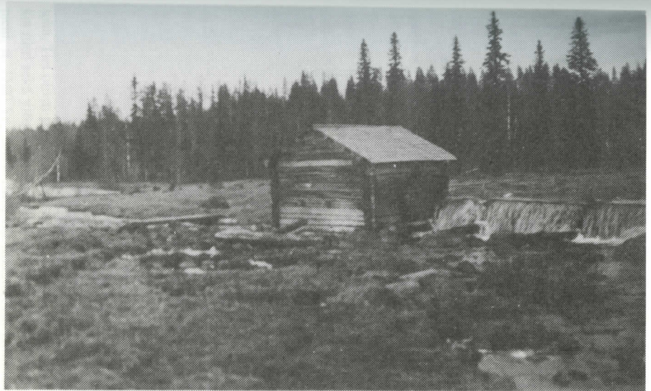
Kylän mellitsä oli vähäsen Kuivajärvestä jokea alavirtaan.