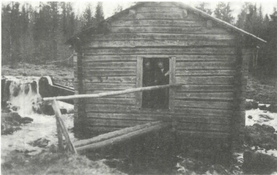
Mellitsään pääsi kapeaa porrasta myöten.