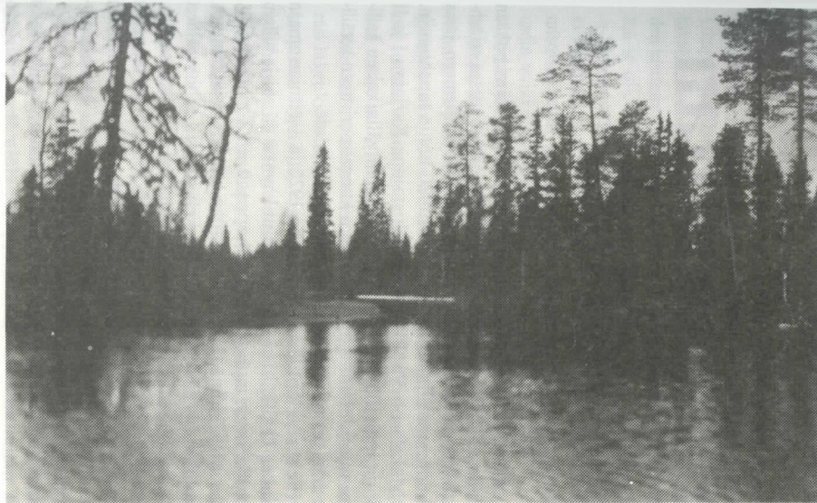
Venematka jatkuu; edessä Kuivajoen suu.