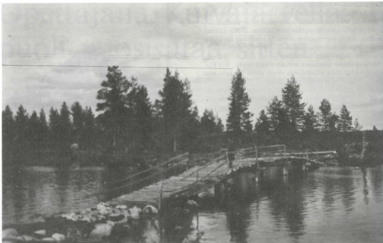
Kuivajärven ja Pienen Kuivajärven välisen salmen vanha puusilta; se korvattiin uudella 1938, jolloin takana näkyvään metsikköön oli jo kohonnut tsiässöynä.