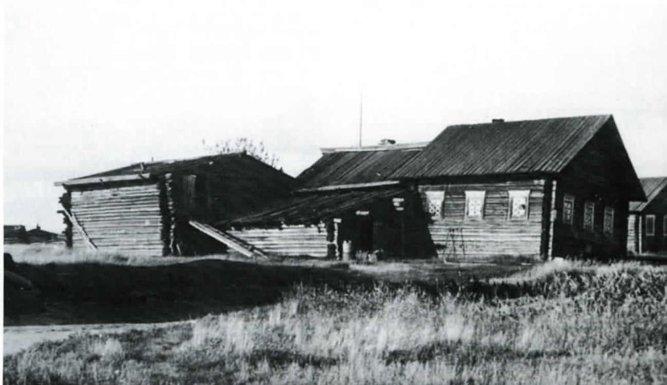
Kiisjokelainen talo apurakennuksineen ennen sodan tuhoja.

Täydennyksenä edelliseen on mielenkiintoista tarkastella