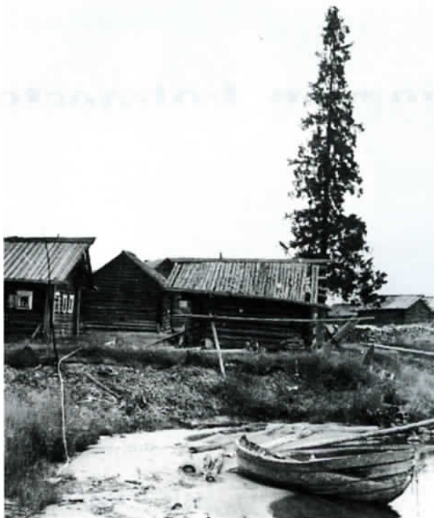
Kotikuusi vartioi tässä jo rapistumaan päässeita rakennuksia.