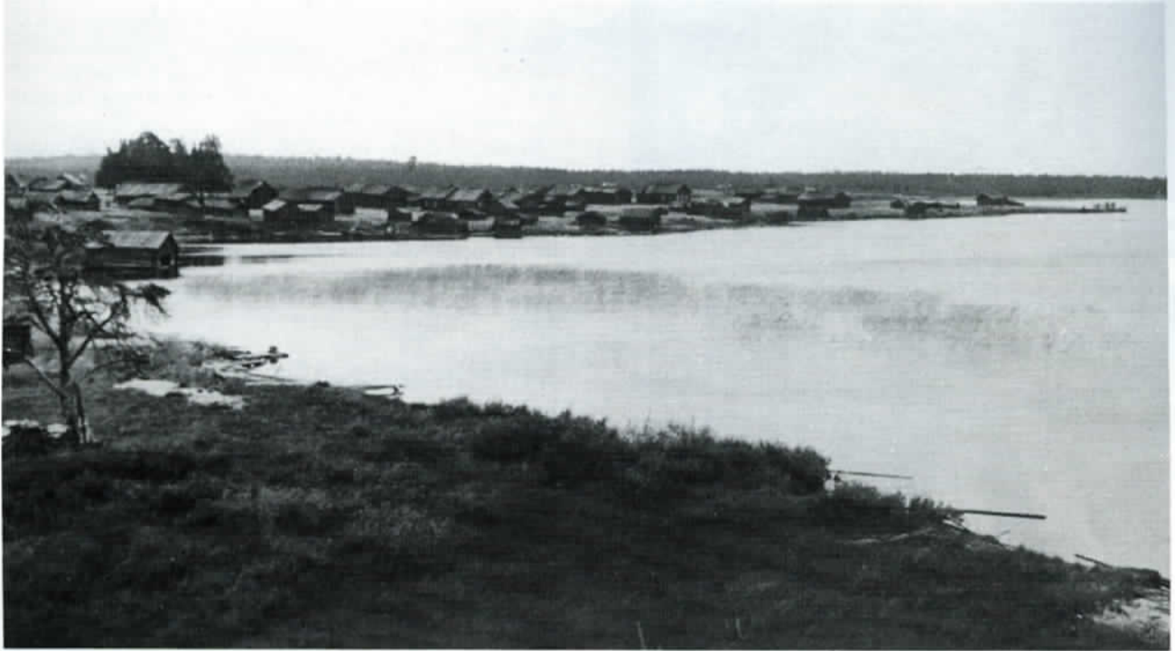
Kiisjoen kylä sijaitsi tiiviinä rykelmänä Tuoppajärven laakealla rannalla.

Kiisjoen vienalaiskylä Tuoppajärven lounaisrannalla noin 40 kilometriä Kiestingistä etelään oli yksi Tuoppajärven kolmestatoista rantakylästä.