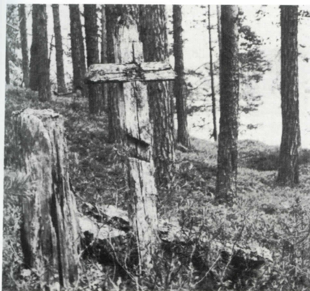
Lesosten esi-isien hautoja Tetriniemen kalmistossa.