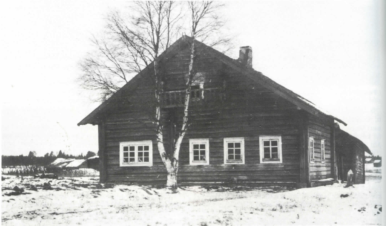
Huureisen talo Roukkulan kylässä.

Roukkulan ja Saarenpään kylät sijaitsivat Repolan pogostan pohjoisosassa Roukkulan järvellä. Saarenpään kylä on nimensä mukaisesti saaren itäpäässä. Roukkulaan on siitä matkaa noin 4 virstaa. Se on osittain saaren länsipäässä, osittain mantereella kapean salmen takana.