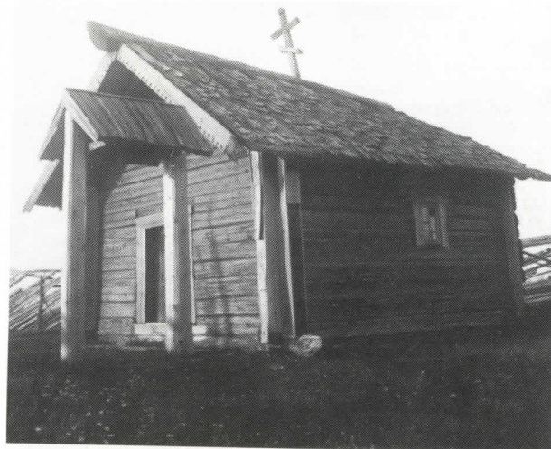
Roukkulan tsasouna.