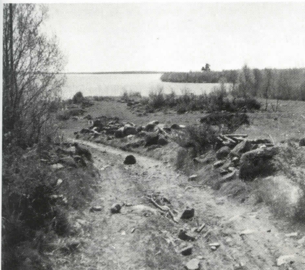
Pyhäniemen rautakaivoksen jäännöksiä.

hevosta, kun yhtä suuressa Paatenessa vain 93. Työhevosia oli kummassakin pitäjässä yli kuusisataa.