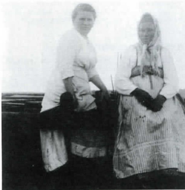
Röhön naisväkeä. Tunteeko kukaan?

hosta ja perunamuhennoksesta — perunaa sentään oli saatu runsaasti — tehtiin rieskaa.