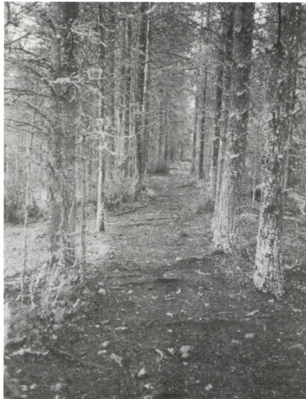
Korkeaniemen läpi kulkee leveä polku paksukaarnaisten mäntyjen katveessa.

Vienan kielikurssin toiseksi viimeisenä päivänä kävimme koko ryhmä Röhössä, mutta vain Matalaniemen puolella.