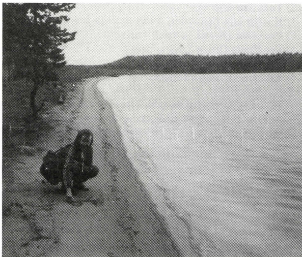
"Tule Röhön rantaan, siellä piirrän kuvan sanaan..." Ahoniemi Matalaniemen kärjessä.

Linja-automme ajoi Lehtoniemeen ja sieltä vaelsimme pitkän Röhön rantaa Matalaniemeen, aina sen kärkeen Ahoniemeen asti, missä aikoinaan oli ollut kuuluisa sininen siltayhdistämässä Röhön molemmat osat toisiinsa. Härkösalmi, jonka yli silta kulki, on paikoin hyvinkin syvä. Lehmät uivat kuulemma sen yli, mutta meillä ei sellaiseen ollut aikaa eikä sääkään houkutelut uimaan.