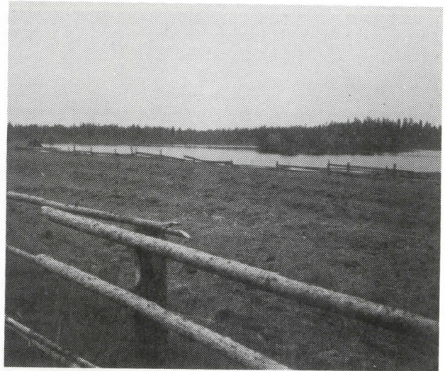
Hoikkajärvi, takana kalmistaa ja salmi Mutalampeen. "Tule Röhön rantaan sinisillalle." Ahonniemestä pääsi kuuluisaa Sinistä siltää myöten Korkeaniemeen.