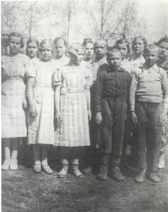
Maikkulan oppilaita vuodelta 1938.

Salissa vallitsi hiljaisuus, tarkkaavaisuus. Jännitys. Minulla oli sellainen käsitys, että opettajat toivoivat presidentiksi uudellen Pehr Evind Svinhufvudia ja kun olin keskustellut toisten koululaisten kanssa, aina kuului toivomus: