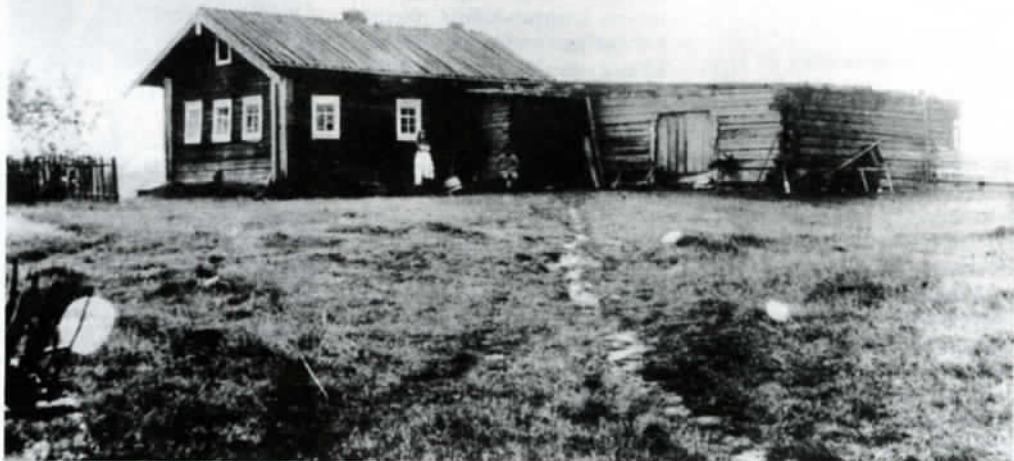
Suaren Pekon, Arhippanen Miikkalin pojan talo Latvajärven suurimassa saarella. Rakennus paloi jatkosodan aikana.

Vedet Latvajärvestä sen sijaan laskivat puroja ja jokia myöten sekä länteen että itään. Kuikkalahden pohjukasta lähti mutkitteleva, melko runsasvetinen Latvajoki kohti Pirttajärveä ja siitä edelleen Kuittijärven ja lopuksi