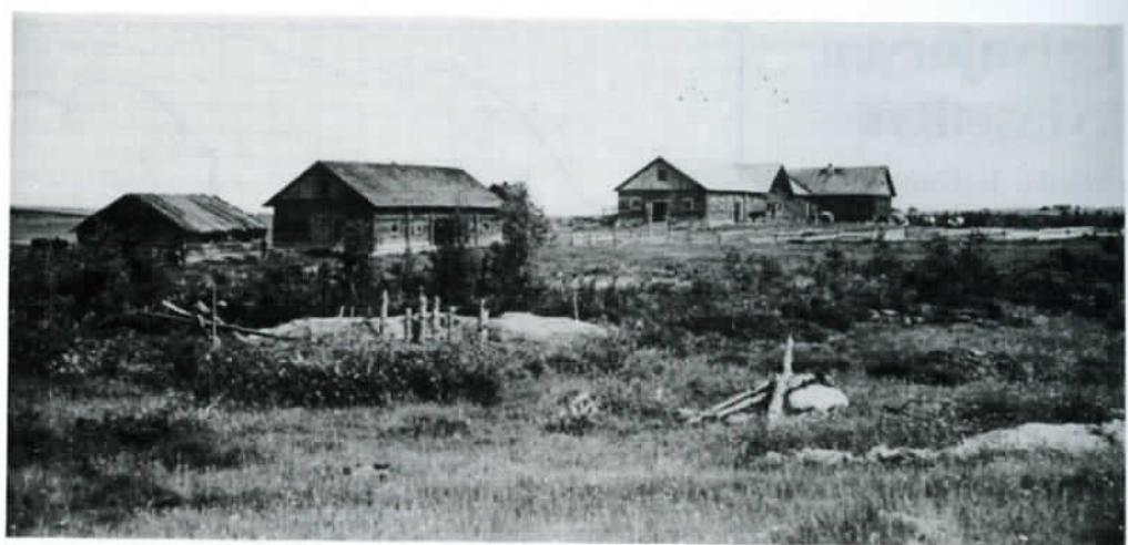
Latvajärven kylä kesällä 1943. Kolhoosin talousrakennuksia; vasemmanpuoleisessa talossa pidettiin lampaita; myöhemmin se oli rehuvarastona, keskellä on kolhoosin sikala, oikealla hevostalli ja navetta.