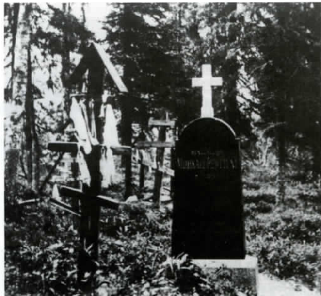
Arhippainen Miihkalin hautamuistomerkki Kalmosuareissa.

Runokylänä Latvajärvi oli niin kuuluisa, että suurin piirtein kaikki kerääjät siellä kävivät. Paljon kylässä perin-