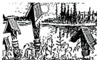
TUONILMAISIIN OVAT SIIRTYNEET

Sakarista kehittyi hyvä pelaaja. Joskus hän yllättää tuloillaan mestaripelaajatkin, kun kiilaa heidän väliinsä. KP