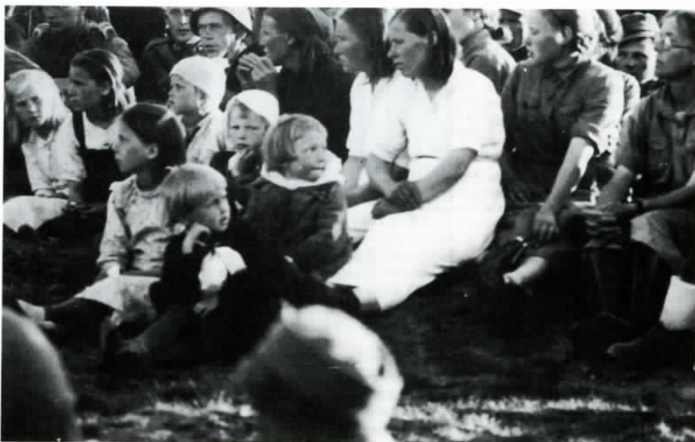
Kyläläiset olivat kutsuvieraina suomalaisten 2.7.-41 järjestämässä Kiimasvaaran valtausjuhlassa.

Saksalaisilla oli omat lääkärintensä. Ainakin kerran muistivat Kiimasvaarassa syntyneet saksalaiset sotilääkärin olleen tekemisissä siviilien kanssa am-