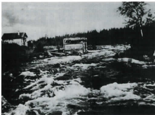
Vitsakosken mylly Pistojoessa Kiimasvaarassa 12.9.1943 (yläkuva) ja 16.7.1994.