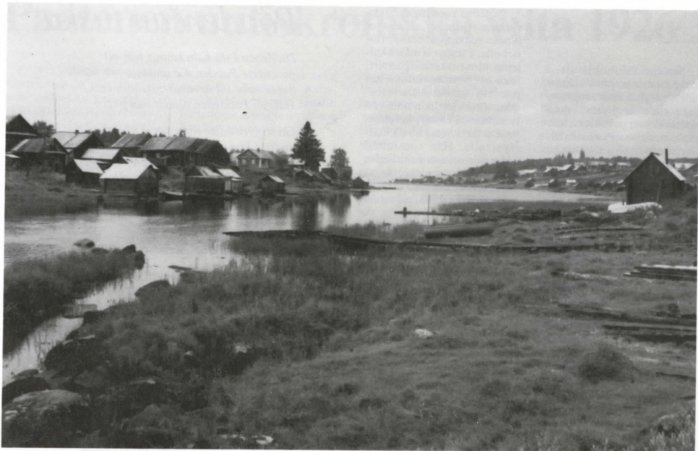
Näkymä Puarostajoen suulta Sellinjärvelle, vas. Präckilä ja oikealla Suvipää.