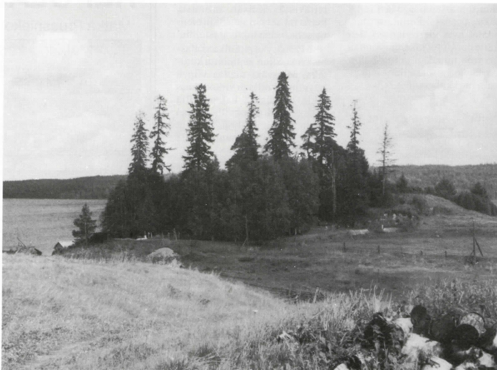
Prokkolan (Jukkoguban) kalmisto Voijärven rannalla.

Aina itsekin tapasin naisen, joka oli 11-vuotta vanha, mutta vielä kuin morsian ikään, niin terveen näköinen. Kertaakaan eläissään ei ollut vakavasti sairastanut. Syynä tähän ihmisten pitkäikäisyyteen oli nähtävästi itse luonto ja kova työ toimeentulon turvaamiseksi. Ja työtä piti tehdä paljon. Maat ovat täällä kauttaaltaan kiviset. Aatra ja karhi olivat sen ajan