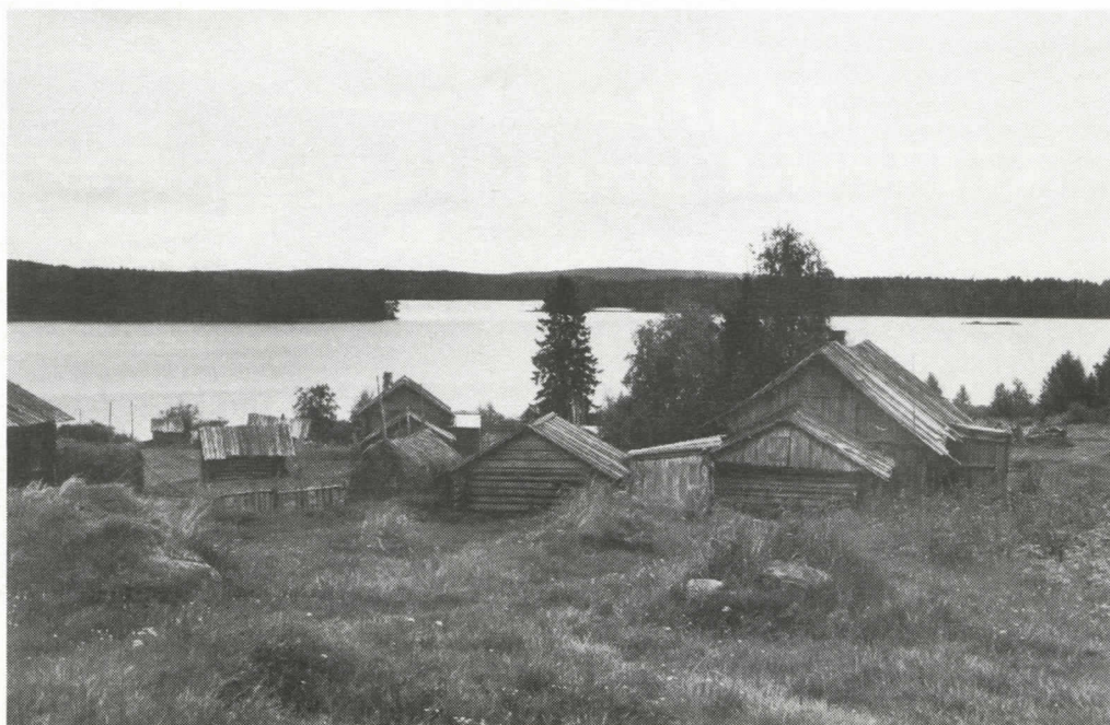
Karjalaisten kylien tapaan Laasariin sijaitsee kauniilla paikalla samannimisen järven rannalla.