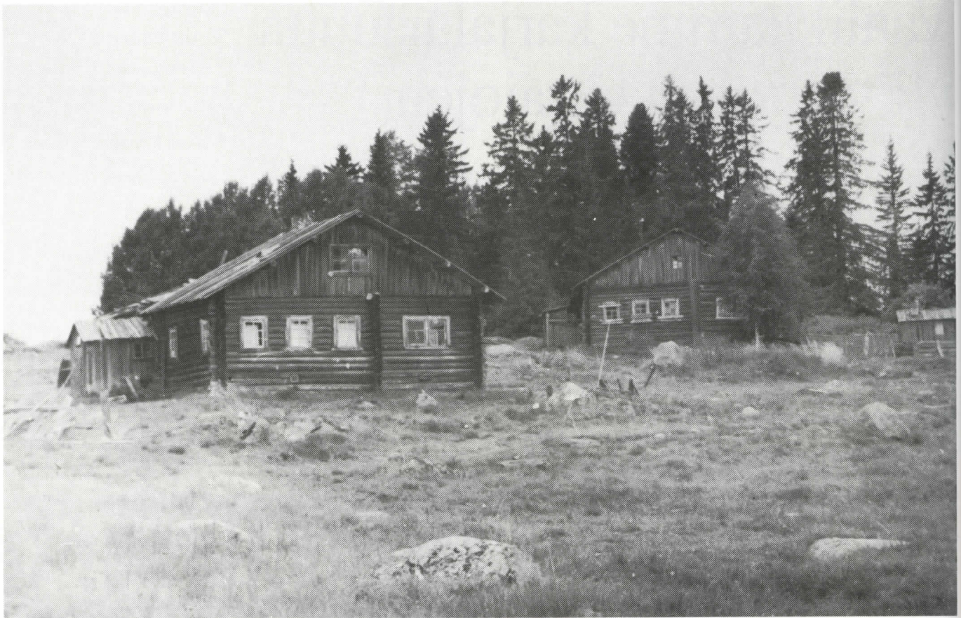
Laasarin kylämaisemaa hallitsee komea kalmokusikko, joka näkyy kauas järvelle. Talot ovat sotien jälkeen rakennettuja, nyt autioita.