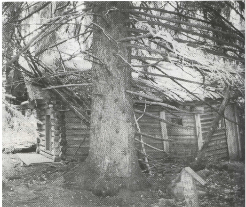
Laasarin tsasounan nurkalla kasvaa jättiläismäinen kuusi.