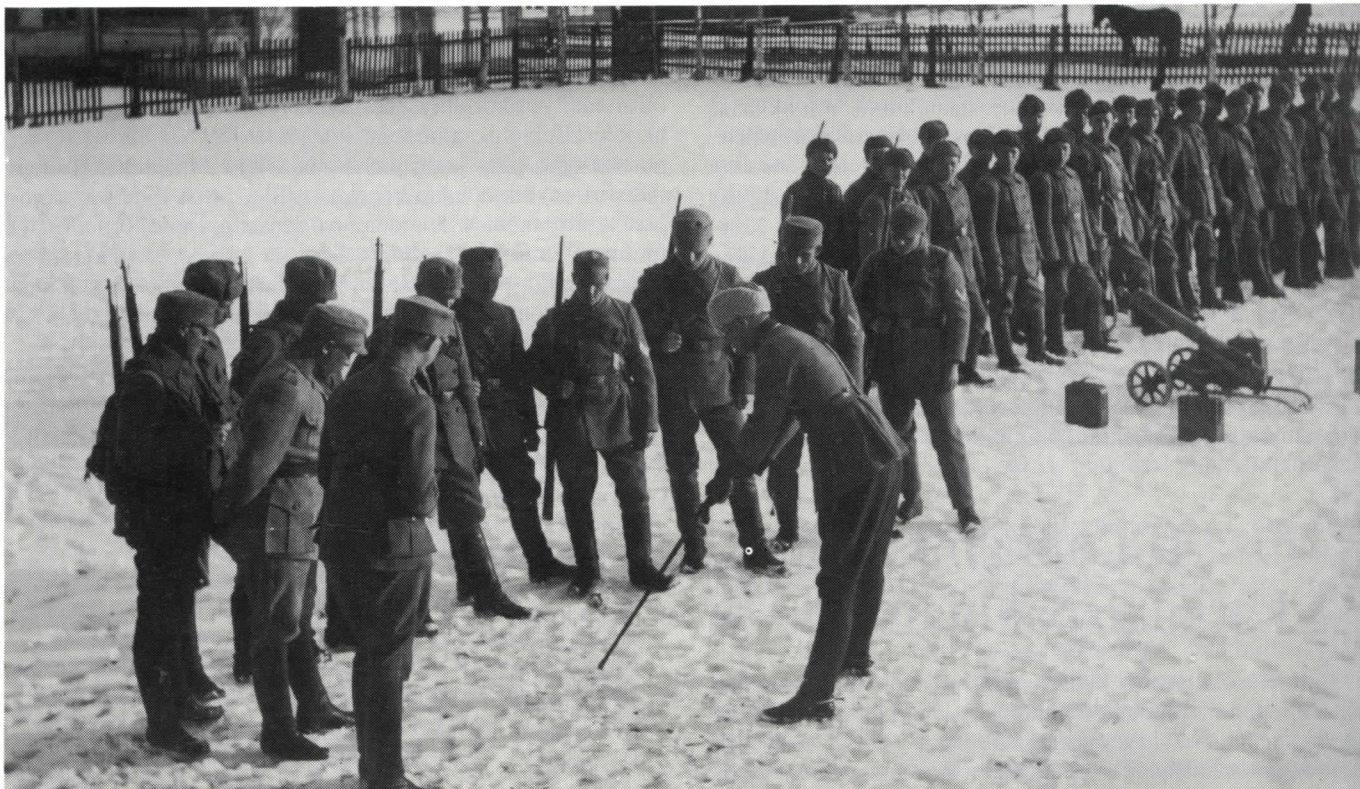
Lapuan koulun karjalaispojat harjoituksissa.