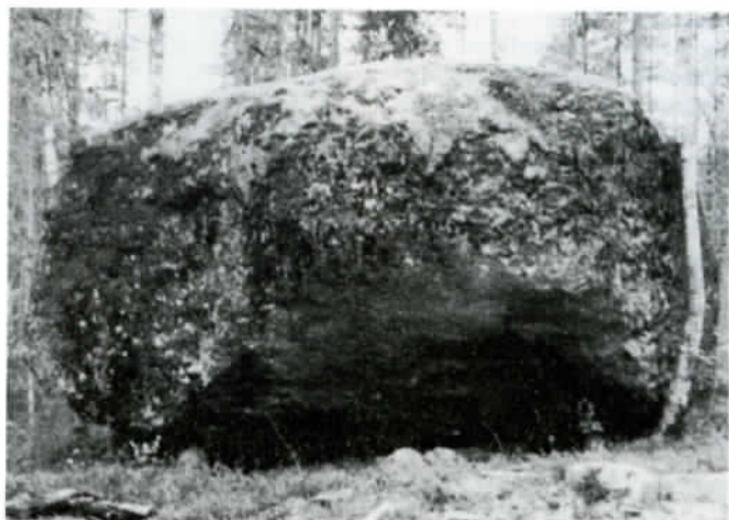
Piessan kivi, valtava siirtolohkare Repolaan vievän maantien varressa.