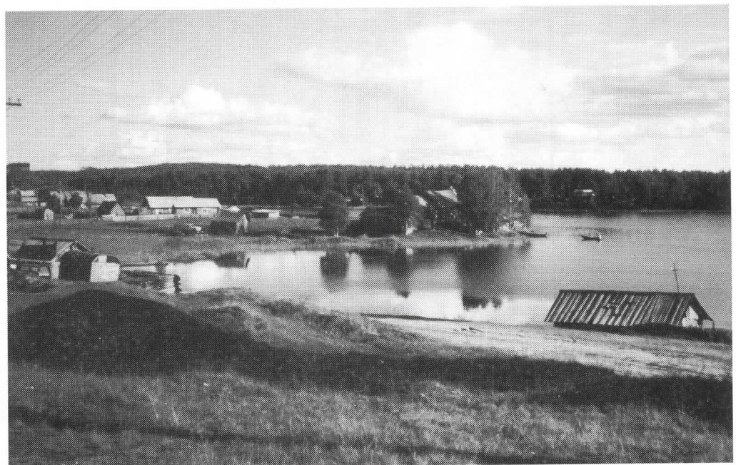
Kylän ainoa asuttu osa on nykyisin Karpanpuoli. Kuvassa Jyrkiniemi, taustalla Innisenlaksi "Pihkatalon" edestä nähtynä.