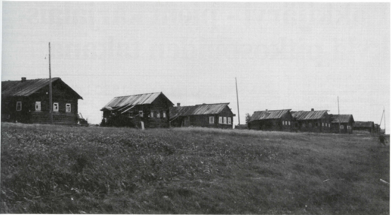
SODAN TUHOT. Kun suomalaiset ja saksalaiset joukot saapuivat elokuun 7. p:nä 1941 Kiestinkiin, perääntyvät venäläiset olivat polttaneet pääosan kylän keskustasta. Eniten ehjiä rakennuksia oli itäpäässä (kuva yllä), mutta näkymä Rantakadun yli Tuoppajärvelle oli kovin masentava. (SA-kuvat).

kylä poltettiin jo 2.8.1941, Lohivaara ja Lohilahti pian elokuun puolivälin jälkeen. Pääosan Oulangan kylästä venäläiset polttivat 8.7.1941 vetäytyessään Pääjärven itäpuolelle. 4.11 olivat vuorossa Niskan ja Kuntijärven kylät ja seuraavana yönä Soukelo ja Miikkulanlahti. Kiestingistä pohjoiseen sijaitsevat Heinäjärven ja Lakkijärven kylät venäläispartiot polttivat alkutalvesta 1942. Tiiksjärven kylästä paloi 12 taloa 15.1.1942 ja loput, samoin Jelettijärvi, myöhemmin taistelujen yhteydessä.