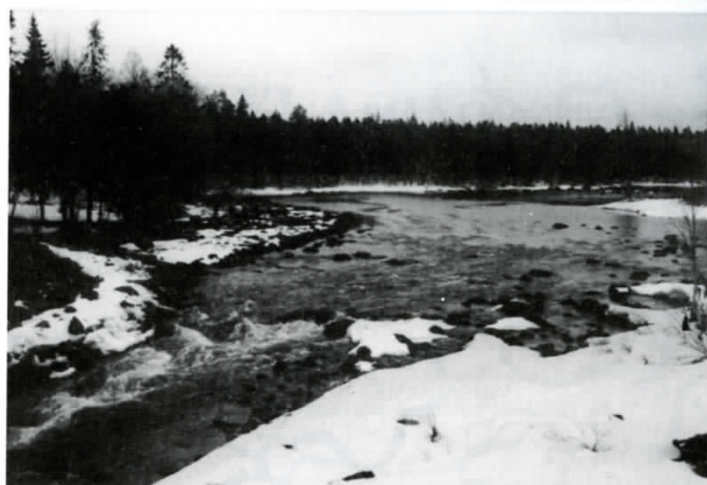
Nokeuksen koski Kostamukseen vievän maantien sillalta nähtynä. Riikosen kylänosa jää tästä katsoen oikealle.

Pääkönniemen asukkaista tiedetään muistitietojen perusteella se, että 1920-1930-luvulla kaikki olivat suvultaan Stepanoffeja eli siis saman suvun jälkeläisiä. Niinpä kaikki Kuhmoon pakolaisina tulleet Stepanoff-nimiset olivat pää-