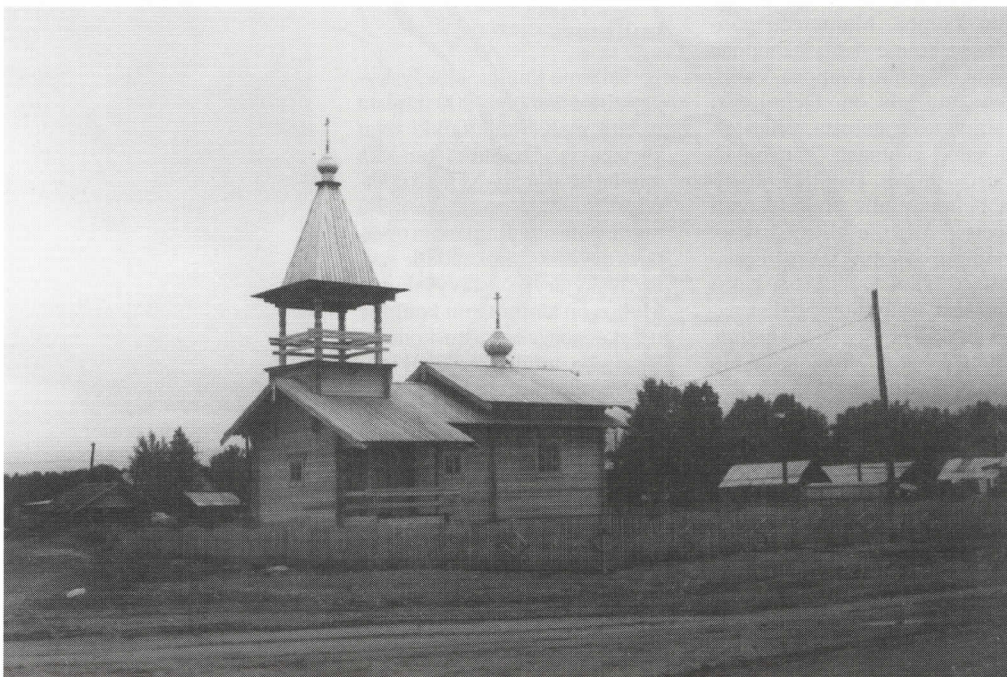
Jyskyjärven uusi tsasouna on tien varressa keskellä kylää.

□ □ Jyskyjärven volostin elämästä vuosisadan taitteessa saa hyvän käsityksen seurakunnan vaiheista kertovasta artikkelista, joka julkaistiin KH:ssa n:o 3-4/1998.