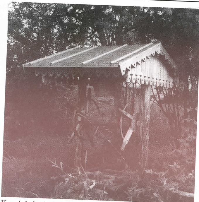
Kaunis kaivo Dobrininan saarella. Kaivo on kylässä harvinaisuus, sillä vesi otetaan joesta.