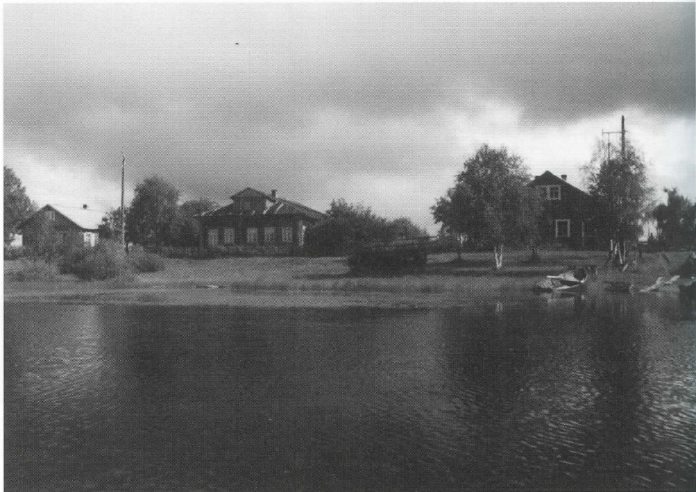
Dobrininan saaren vanhoja karjalaistaloja ja siistiä Tsirkka- Kemijoen rantaa.

Saaria kutsuttiin aikoinaan ensimmäiseksi, toiseksi ja kol-