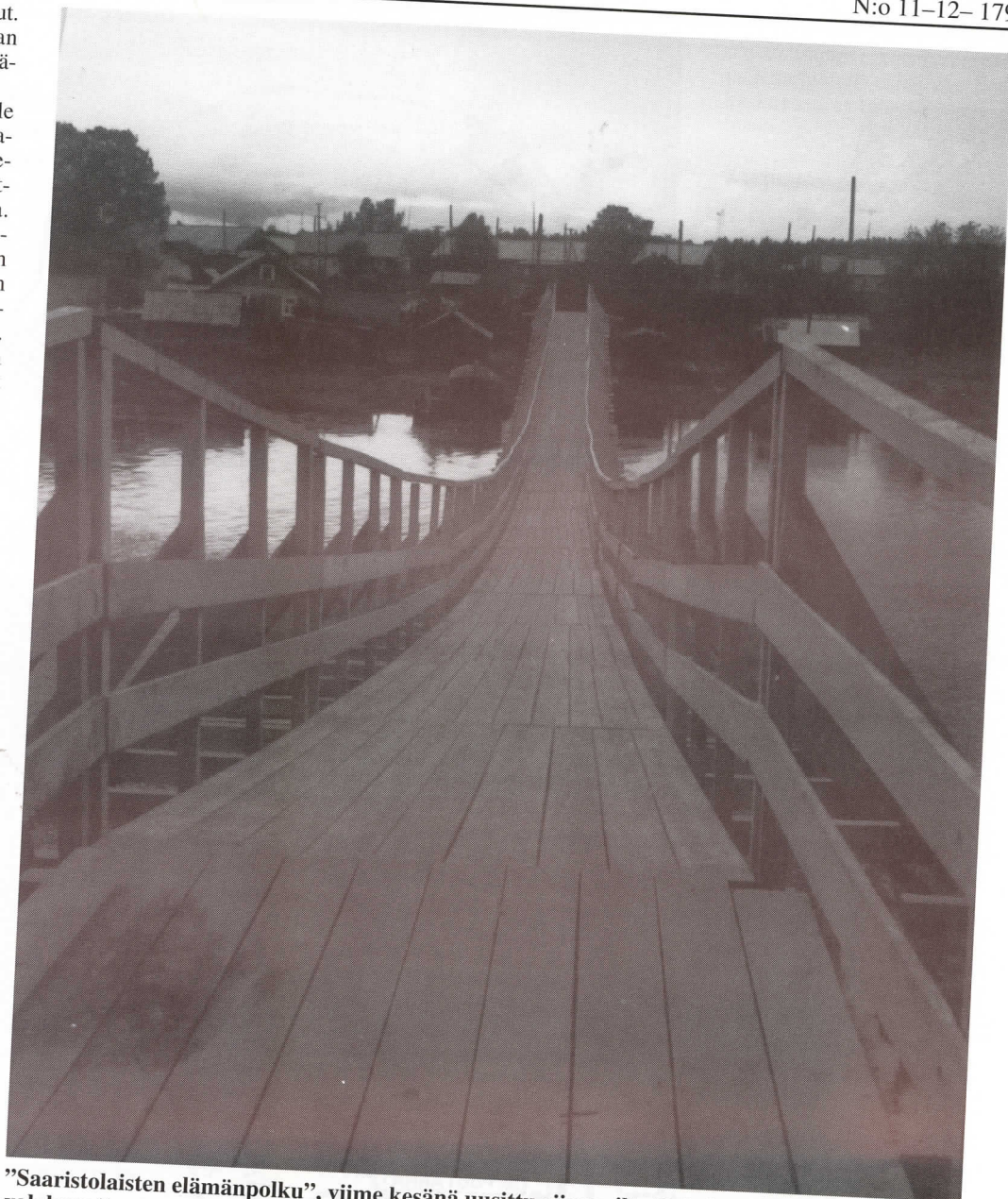
"Saaristolaisten elämänpolku", viime kesänä uusittu riippusilta Dobrininalta mantereelle päin valokuvattuna.

Tontit ovat yleensä pieniä, kooltaan ehkä 600 - 800 neliötä. Rakennusten lisäksi niille ei mahdu paljon muuta kuin perunapello ja tie. Vieressä olisi kyllä entisen kolhoosin laajat pellot, mutta niistä ei lisämaata kuulemma myydä. Niinpä lampaiden heinät pitää keräillä joen rannoilta ja teiden varsilta. Ainoat kotieläimet, joita saarella näin, olivat lampaat, kanat, koirat ja kissat, mutta Helmi kertoi, että jollakulla on myös lehmä navetassaan. Itse hän aikoi