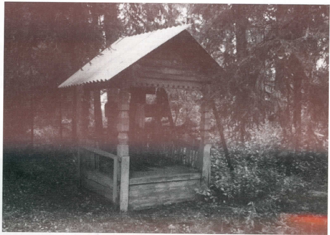
Tsasouan vieressä on koristeellinen hirsikatso suojaamassa vanhaa ristiä.