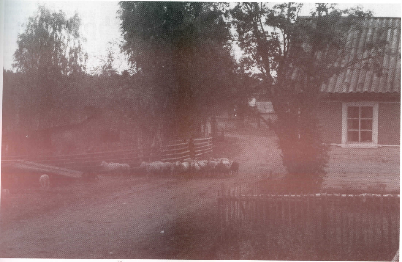
Iso lammaskatras elävöittää hiljaista kylätietä, joka johtaa taaemmaksi viljelyksille ja kalmismualle.