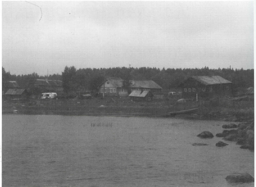
Kiviniemen kylän talot reunustvat lahden kaarevaa rantaa.

Annin syntymäkotona oli tavallinen karjalainen talo, ei pohatta, ei köyhä. Navetassa oli neljä lehmää, kaksi hevosta ja lampaita. Kun sitten kylään perustettiin kolhoosi Krasnyj navolok (Punainen niemi), niin sinne kohta haettiin Kirilovienkin taloudesta toinen hevonen (onneksi vanhempi) ja kolme lehmää. Yksityislehmiä sai olla