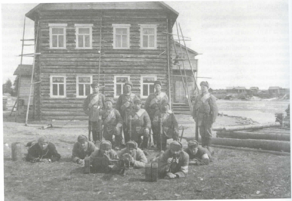
Retkikuntalaisia kuularuiskuineen Uhtuan vanhan postitalon luona kesällä 1918.

neiden puutteessa katkaistuksi, kun parin puusillan polttaminen ei punajoukkojen vastarinnan vuoksi onnistunut. Varsinainen Kemin taistelu 10.4 tapahtui kaupungin länsipuolisilla harjanteilla vahvempia punaisia puolustajia vastaan; Muurmannista eteneviä englantilaisia ei täällä vielä ollut. Hyökkäys, johon jälkijoukot eivät edes ehtineet mukaan, ei onnistunut, vaan muuttui perääntymiseksi. Takaisin Piepajärvellä oltiin 11.4 ja Paanajärvellä levättiin pari päivää 15.4 saakka. Kelirikkoisia teitä vedäydyttiin Uhtualle, jonne 17.4