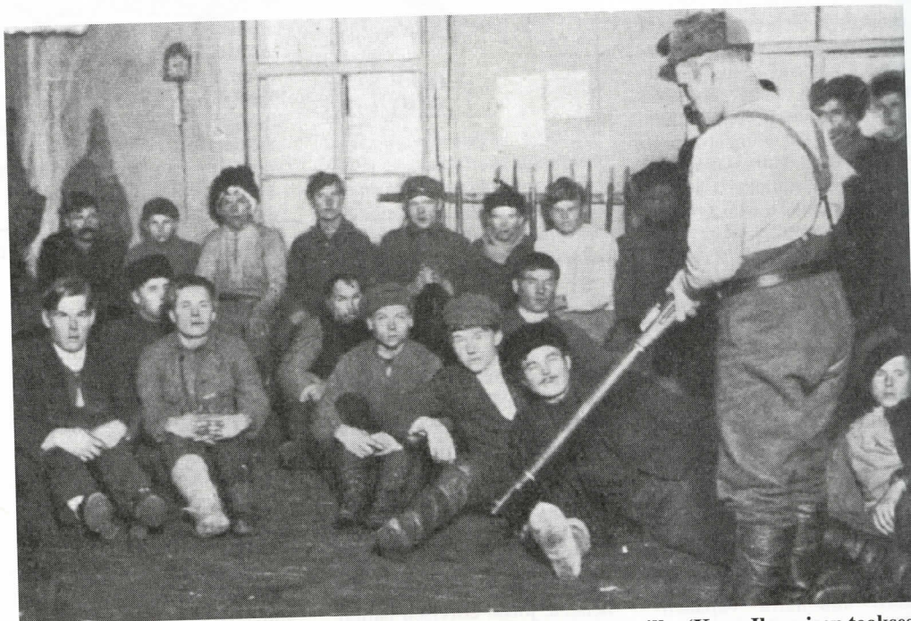
Aseen käsittelyn oppitunti metsäsissien riveihin liittyneille alokkaille. (Kuva Ilmarisen teokselta.)

Metsäsissirykmentti oli taisteluissaan aktiivisin työntäen rintamansa Usmanaan, Voijärvelle ja Tunkualle asti, toisin sanoen varsin lähelle Muurmannin rautatietä. Ratkaise-