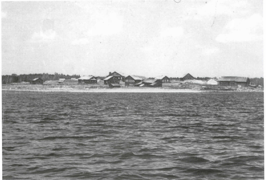
Uskelan kylä oli 1970-luvun puolivälissä vain varjo entisestään; paljon rahvasta oli jo muuttanut pois.

Ongelmalliseksi asian tekee se, että Muujärven kylää ei enää mainita esim. vuoden 1723 väestönlaskennassa eikä ilmeisesti myöskään äsken mainitussa Usmanan volostin dokumentissa. Tuohon vuoteen (1723) mennessä - itse asiassa jo noin puoli vuosisataa aikaisemmin - Muujärven rannalle oli sen sijaan syntynyt kaksi uutta kylää, Uskela ja Ahvonniemi. Kolmantena uutena kylänä oli kauempana koillisessa Piepjärven lähellä syntynyt Lesola.