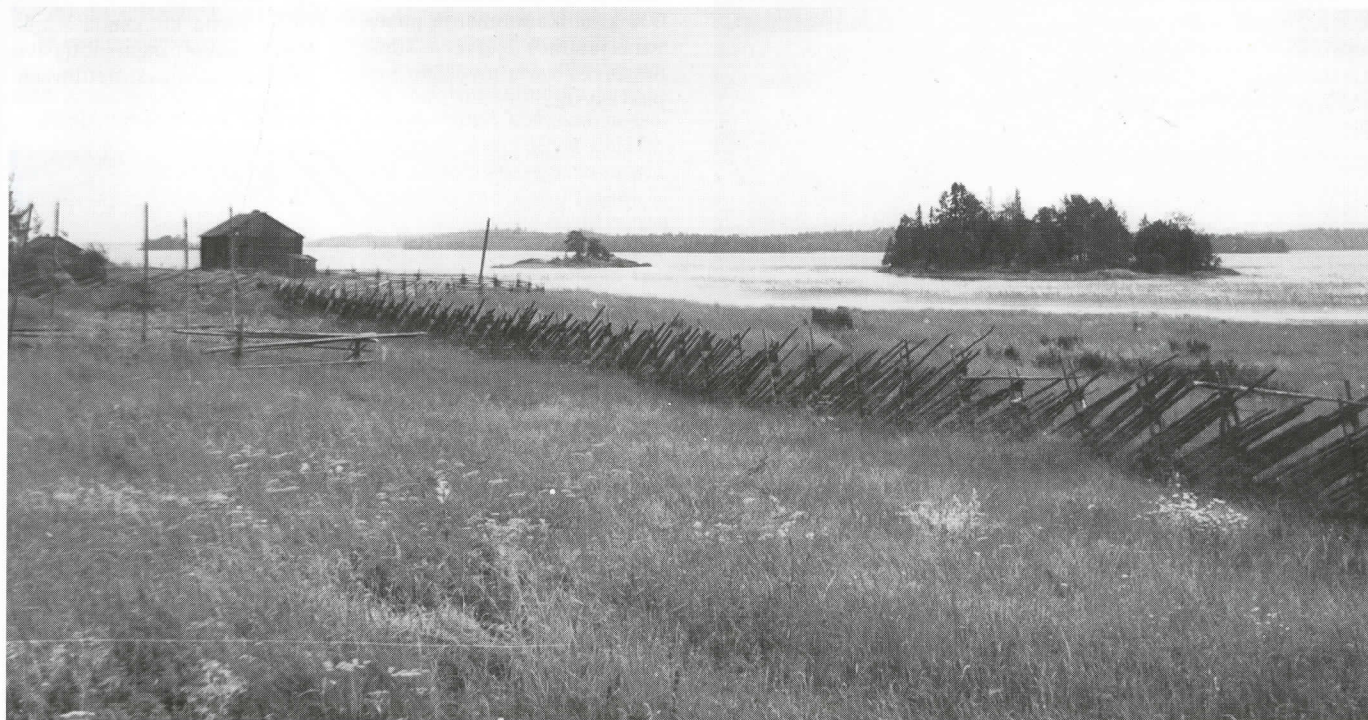
Uskelan kylänrantaa, oik. Pitkäsaari, siitä vasemmalle Lyhytsaari.