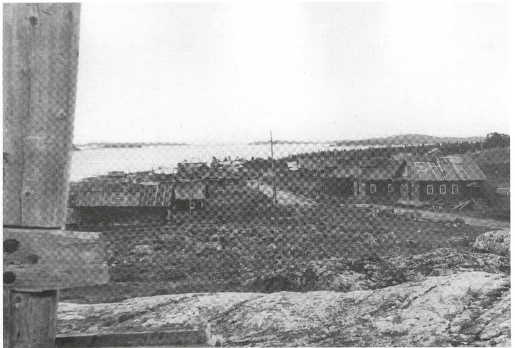
Kouta sijaitsee samannimisen joen suussa Vienanmeren kivisellä rannalla. Meri on siellä ollut aina elannon antaja.

T:mi Russanoff ja Pojat (The White Sea Saw Mills Co Ltd), 4-raaminen, vuosituotanto 7 000 standarttia, työväkeä 250