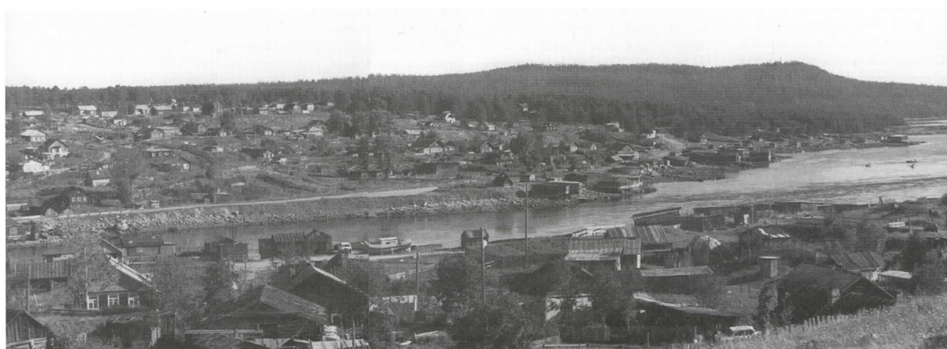
Knäsö oli ennen vallankumousta tuttu paikka karjalaisille: pohjoinen kauppareitti, ns. jauhotie Oulangasta Koutajoen vesistöä seuraten johti tähän Vienanmeren rannikkokylään.

1920-luvun puolivälissä Knäsöissä toimi jo neljä kauppa - osuukauppa, Muurmannin rautatien kalastusyhtymän kauppa sekä kaksi yksityiskauppaa. Punaisen Karjalan kirjeenvaihtajan mukaan niissä oli kuitenkin varsin vähän tavaraa ja hinnat olivat korkeat (kaiken kohtuuden yläpuolella). Esim. ruisjauhot maksoivat 2-2,90 rpl puuta, valkeat jauhot 6-7 rpl puuta, paloöljy 13 kop naula ja niitä oli harvoin saatavissa. 1930-luvulla kylässä toimi enää osuukaupan myymä-