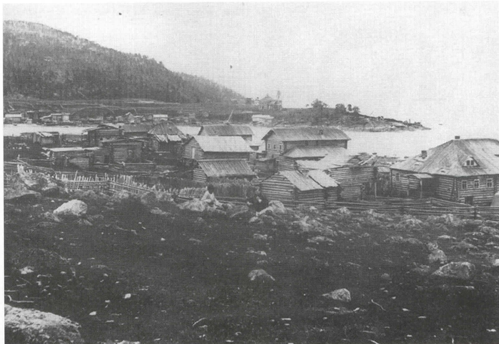
Kannanlahti oli 1800-luvun puolivälissä pieni, puuhökkeleiden muodostama kalastajakylä. Taustalla olevalla niemellä on nykyään suuri merisatama.

Kemin pohjoispuolen tärkeitä kauppapaikkoja olivat vanhastaan volostien keskukset Kouta ja Kieretti, joita kutsuttiin nimellä sloboda eli asutustaajama. Näitä kahta merkittävämpi oli Kannanlahden kauppapaikka; siitä käytettiin nimeä posad, joka tarkoittaa linnoi-