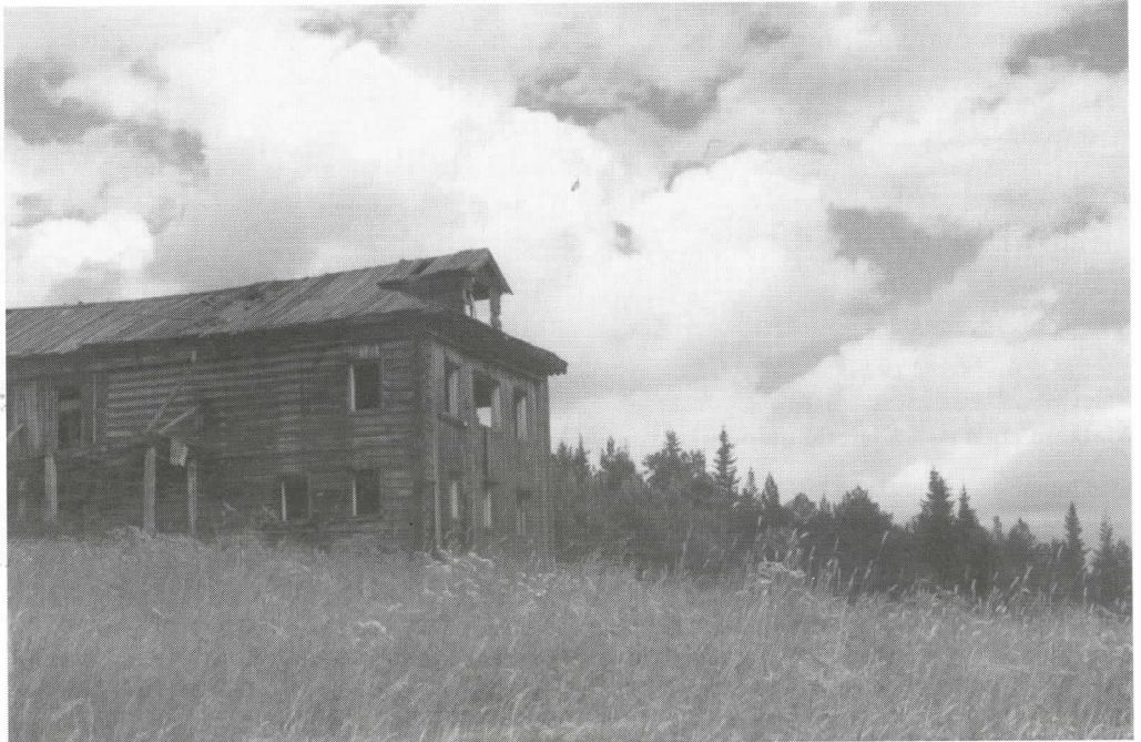
Vanha mahtitalo katsoo nyt tyhjin ikkunoin Kieretinlahdelle.

Kylästä oli välttävä tieyhteyks Tškalovskin kautta suurempiin asutuskeskuksiin. Tavarat kuljetettiin kylään talvella rekikelin aikaan. Kesällä tie oli