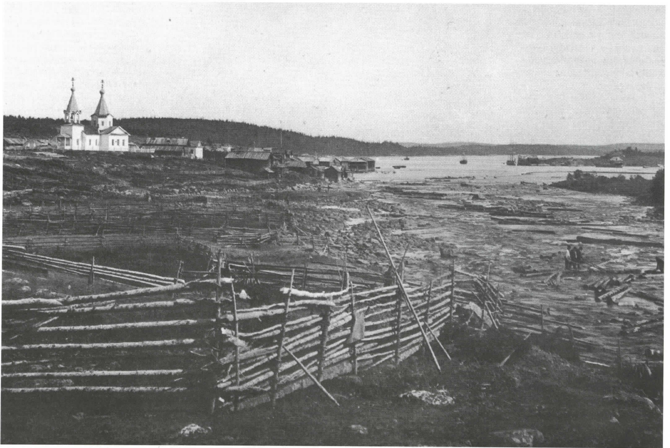
Kieretin kirkko, joka tuhoutui tulipalossa v. 1949, sijaitsi kumpareella kylän länsipäässä. Oikealla laskee Kierettijoki kohisevana koskena merenlahteen; meneillään on tukinuitto

luvulla paikalliset kalastajat keittivät suolaa omiin tarpeisiinsa, mutta sitten teollinen valmistus syrjäytti tämän vanhan elinkeinon.