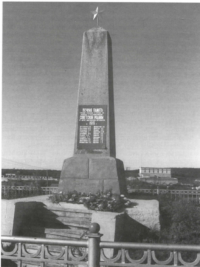
Korkealla kukkulalla Knäsöin kylän vieressä on muistomerkki anglo-amerikkalaisia maahantunkeutujia vastaan v. 1919 käyt-tyjen taistelujen uhreille. Laatassa on kaksikymmentä nimeä.

Maahanmuuttajien ensimmäinen työ oli kunnostaa asunnot. Aluksi oli käytettävissä vain yksi sotilaskasarmi. Tyhjiä parakkeja Knäsöissä kyllä oli enemmänkin, mutta ne kuuluivat enimmältään Muurmannin rautatielle; virastobyrokra-tian vuoksi niihin oli työläs saada käyttöoikeus. Uuden rakentaminen oli sekini hidasta. Oli vaikeuksia lupien ja puutavaran hankkimisessa, ja kun kaikki näytti olevan kunnossa, il-