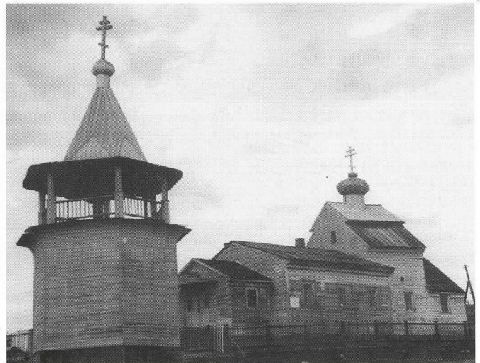
Koudan Miikkulalle pyhitetty kirkko on peräisin 1700-luvulta.

Vallankumouksen puhjettua sahojen toiminta tyrehtyi melko pian raaka-ainepulaan, ra-