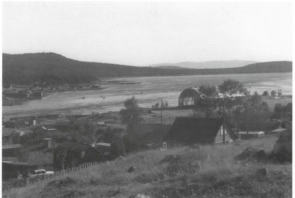
Knäsöinlahti, joka pistää runsaan viiden kilometrin mittaisena mereltä sisämaahan, tarjosi ennen hyvät edellytykset laivaliikenteelle.

Mitä taas vesiputouksiin tulee, niin Knäsöin kannakselle voi muodostua Karjalan suurin vesiputous. Koutajärven vedenpintaa kohottamalla ja Läkkinan uoman sulkemisen avulla putoukorkuutta voidaan saada 32 metriä. Siihen voidaan tulevaisuudessa rakentaa Kar-