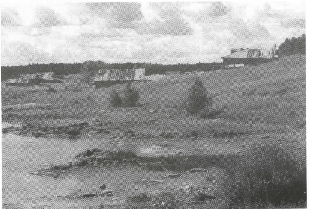
Nousu- ja laskuvesi huuhtovat Kieretin autiota kylänrantaa. Taloja on vielä pystyssä kymmeniä.