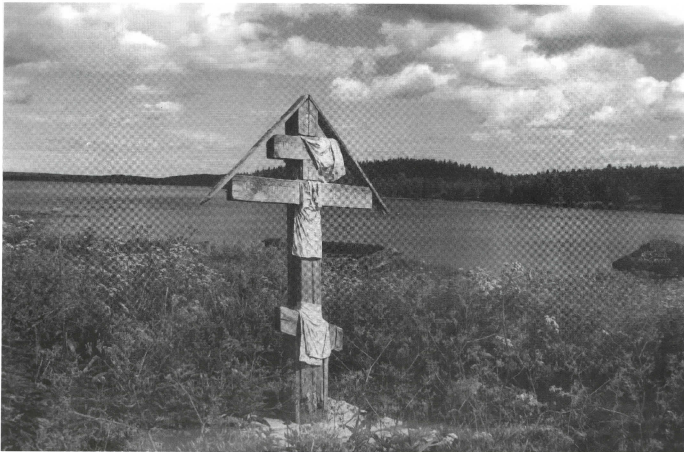
Matkamiehen risti Kieretin umpeenkasvaneen kylänraitin varrella.

näet huonossa kunnossa ja laivamatka Tsupaan verrattain pitkä. Kylässä oli suuri koulu sekä internaatti syrjäkylistä tulevia koululaisia varten.