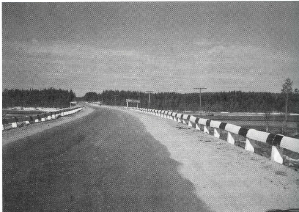
Komea silta vie yli Tsirkka-Kemin, kohta tullaan Tiksaan ja vajaan tunnin ajon jälkeen ollaan jo Rukajärvellä.

Vanhainkotiin eivät kaikki vanhuksat mahdu, joten osaa huolletaan koteihinsa. Koti-