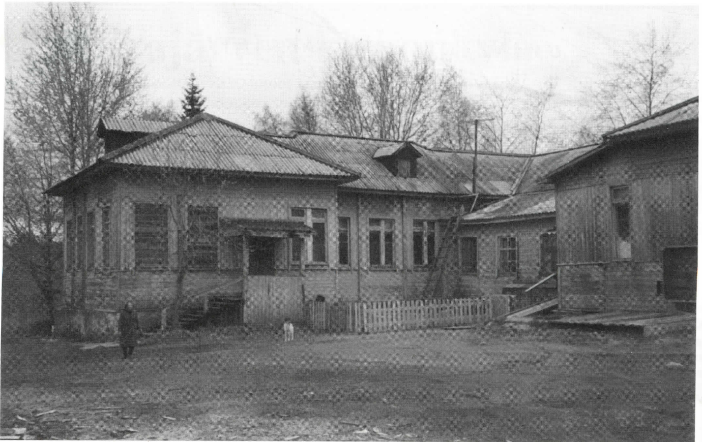
Rukajärven vanhainkoti sisäpihan puolelta nähtynä. Talossa on tätä nykyä 17 hoidokkia, 12 naista ja viisi miestä.