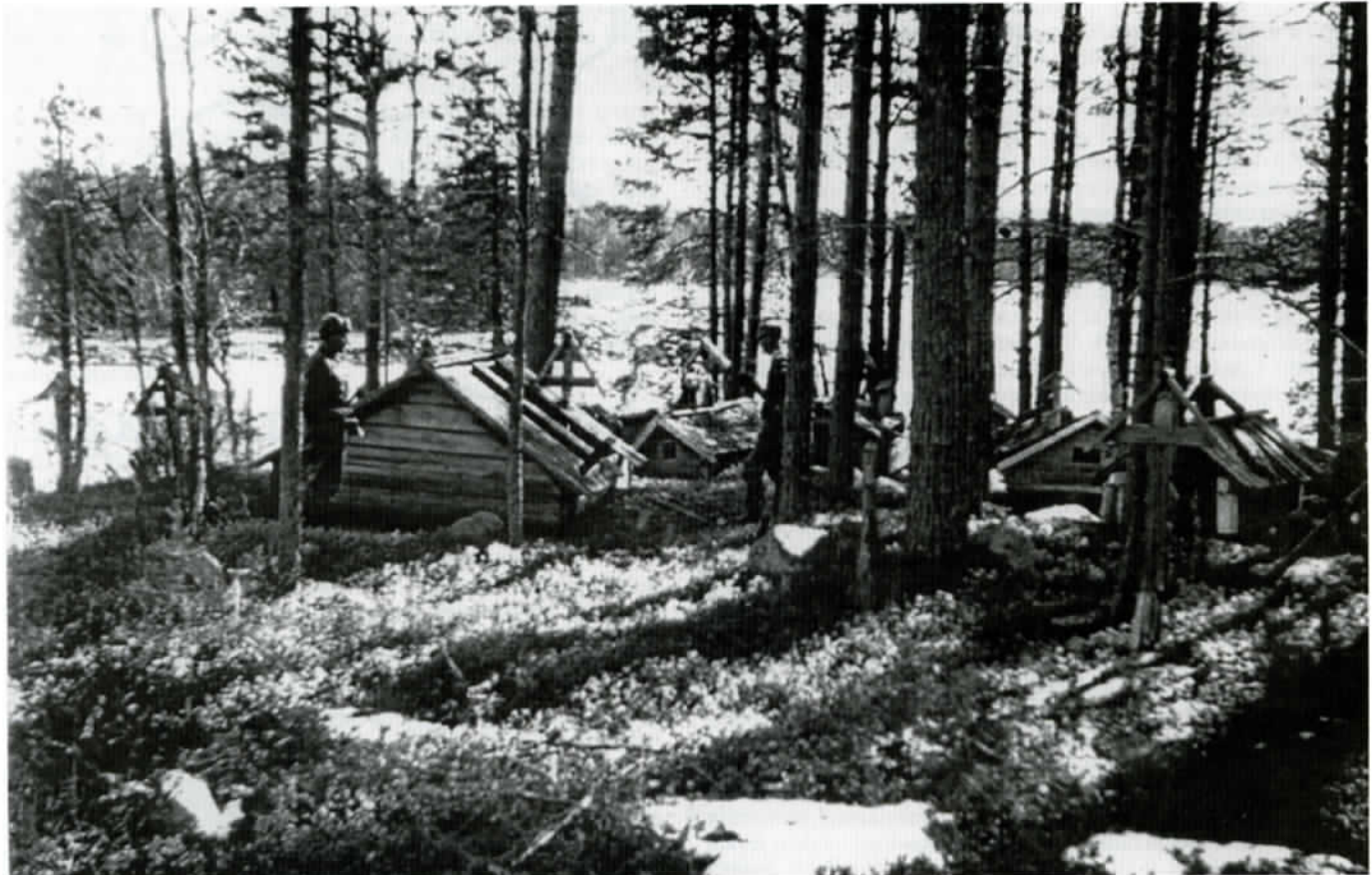
Alajärven vanha kalmisaa sijaitsi mantereella lähellä keskikylää. Nyt se on hävinnyt ja jäänyt veden alle.

16) Makarien Puavilan (Vasilejeff) talo oli syrjässä rinteellä niemen puolella. Puavila oli isän serkku. Talossa oli pirtti ja kaksi isoa kamaria. Puavila oli invalidi, toinen käsi oli koukussa. Se oli vammautunut sodassa, näin isä kertoi. Puavilan vaimo Muarie tai