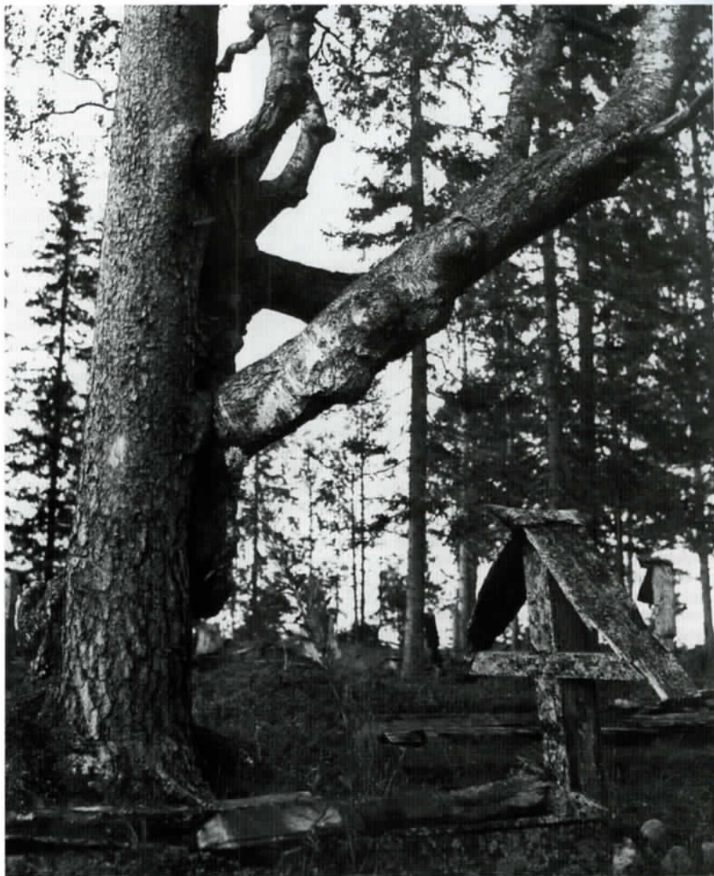
Näkymä Suvannon vanhalta kalmismaalta. Etualalla ristikkäin kasvaviin puihin liittyy traaginen tarina kahdesta nuoresta rakastavaisesta.