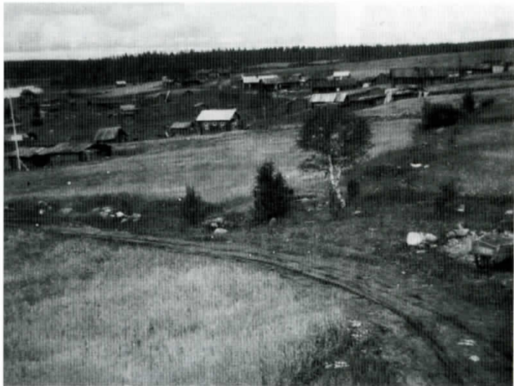
Kylänäkymä on valokuvattu koilliseen Kauroalan talon portailta.

Heimosotien aika merkitsi suvantolaisille niin kuin koko Karjalan rahvaallekin suuria kärsimyksiä. Pistojarvelaiset puolustivat kotiseutuaan sekä neuvottelupöydässä että tarpeen tullen myös ase kädessä.