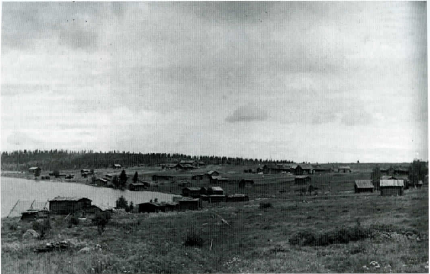
Näkymä Suvannon kylään etelästä Ortjonniemeltä, vas. Suvantojärvi, jota kylät sekä vene- ja nuottalavot reunustavat.

kin samoihin aikoihin alkoivat nälkävuodet. Kylän asukkaita, varsinkin kulakeiksi määritettyjä sekä vanhuksia ja lapsia menehtyi ravinnon puutteesta aiheutuneisiin sairauksiin. Myöhemmin elintarvikehuolto parani ja kylään saatiin kauppa, joka sijaitsi Kaurolan talossa.