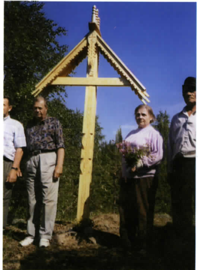
Entisiä pistojärveläisiä hiljentymässä matkamiehen ristin juurella Suvannon sillankorvassa.