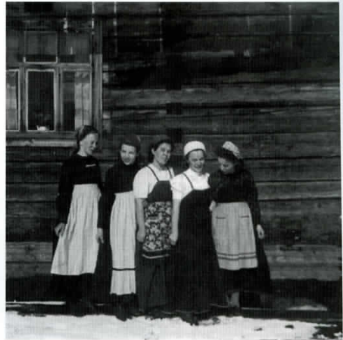
Pistojärveläistä pukumuotia; mannekiinit lienevät Kiimasvaaran tyttäriä.

Jyrki lienee ollut viidenneksi vanhin. Hän meni naimisiin Katoslammin kylästä kotoisin