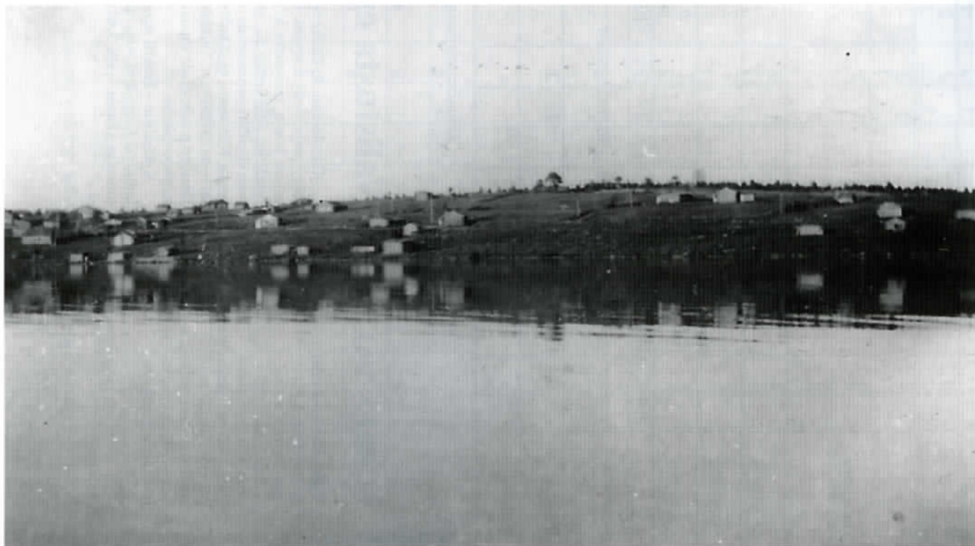
Suvannon kylää järven puolelta katsottuna vuonna 1942.

Pistojärven kunta eli volosti kuului vanhan Venäjän aikana hallinnollisesti Vienan läänin Kemin kihlakuntaan. Kunnan keskuspaikkana oli Pisto eli Pistojärven kirkonkylä, joka sijaitsi Pistojärven länsirannalla. Siellä olivat kunnantalo, koulu, kirkko ja pappila. Pistojärvi, josta kunta on saanut nimensä, on noin 20 km pitkä ja leveimmillään 9 km leveä järvi tai oikeammin joen laajentuma Pistojoen vesistöissä. Tämä helmisimpukoistaan kuulu joki saa alkunsa Kuusamosta ja virtaa Kuusamo-, Muo- ja Joukamojärvien kautta Pistojärveen, jonka eteläpäästä se jatkuu ja laskee Vuonnisen luona Ylä-Kuitijärveen.