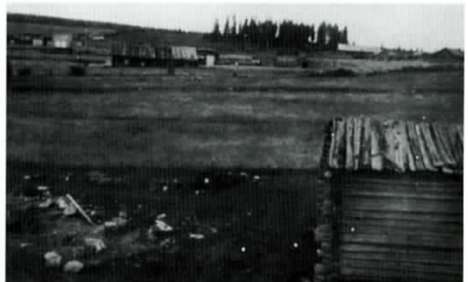
Kyläkolhoosin peltoaukeita, taustalla näkyy kalmismaa.