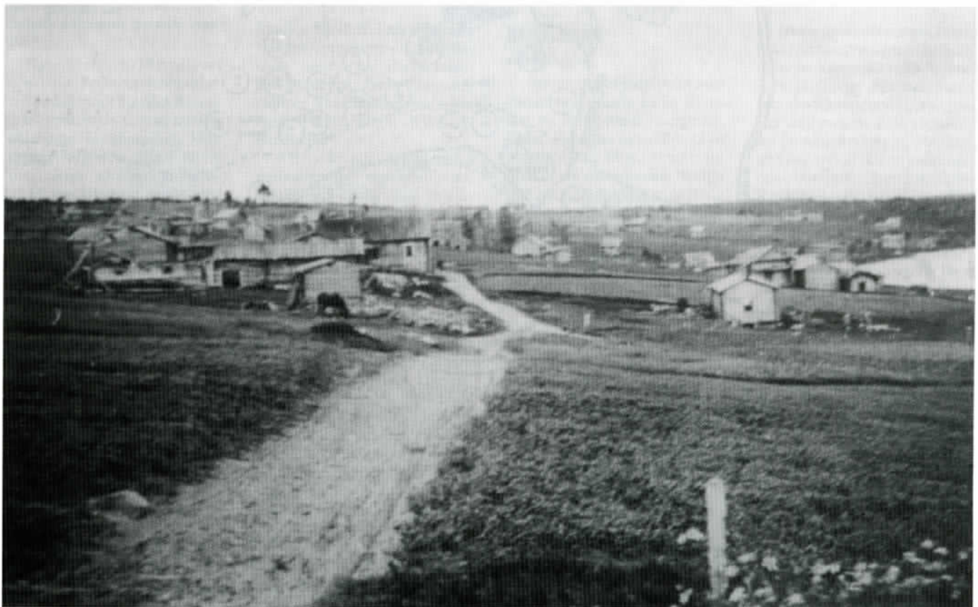
Näkymä Suvannon kylään pohjoisesta päin katsottuna. Vas. edessä Mikittälän talo, Lönnrotin yöpymispaikka. Kotimänty näkyy taustalla vasemmalla.