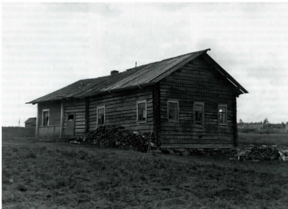
Tässä talossa (kyläkartta n:o II Ullini) toimi kylän kansakoulu.