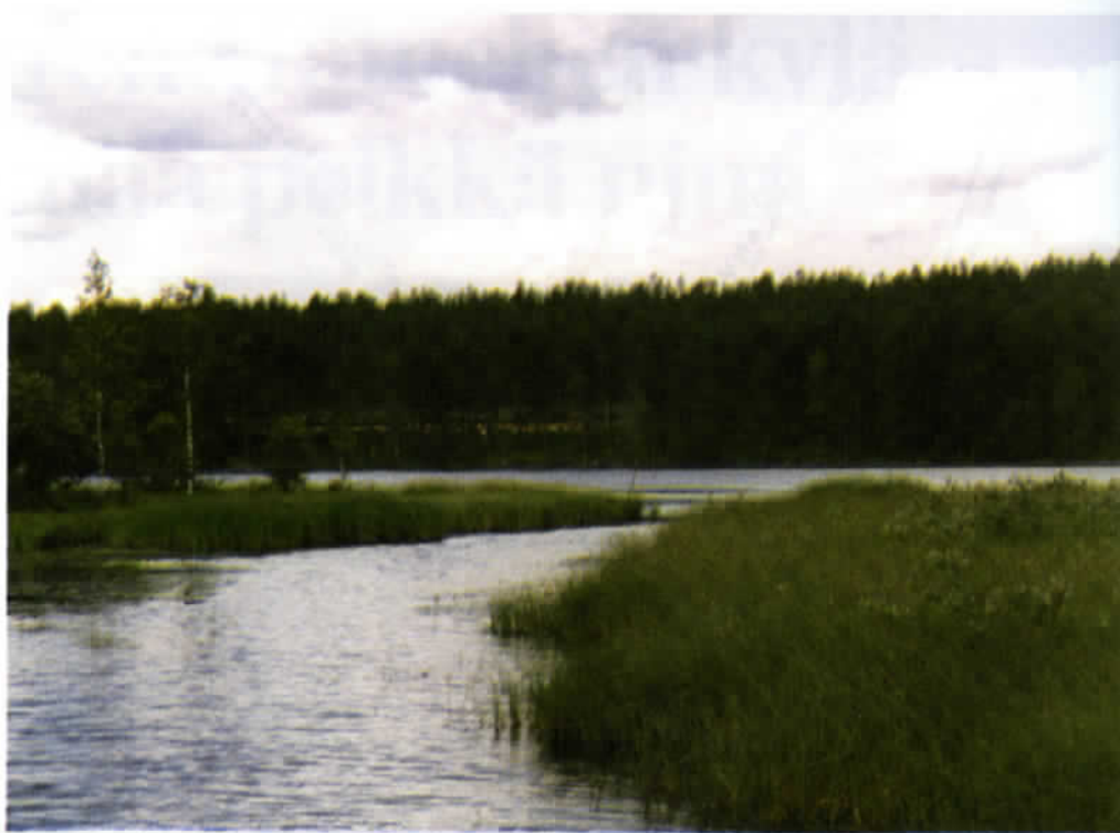
Lammelta johtaa kapea salmi Voikulanjärvelle. Kylän talot olivat pääasiassa kahta puolta tätä salmea.

1920-luvun alussa Pistojärvellä ja koko Karjalassa elettiin levottomia aikoja. Eikä sillä hyvä: elintarvikkeista oli huu-tava pula ja rahvas pysyi hengissä ainoastaan Uhtuan väliaikaisen hallituksen järjestämän vilja-avun turvin. Paikallistalossa vilja, ryynit ja suola jaettiin kyliin perheen koon mukaan, toisin sanoen tietty määrä henkilöä kohti. Vertauksen vuoksi oheisena jauhojen jakolistan helmikuulta 1920. Siinä on mainittu ensin isännän nimi ja perheen koko.