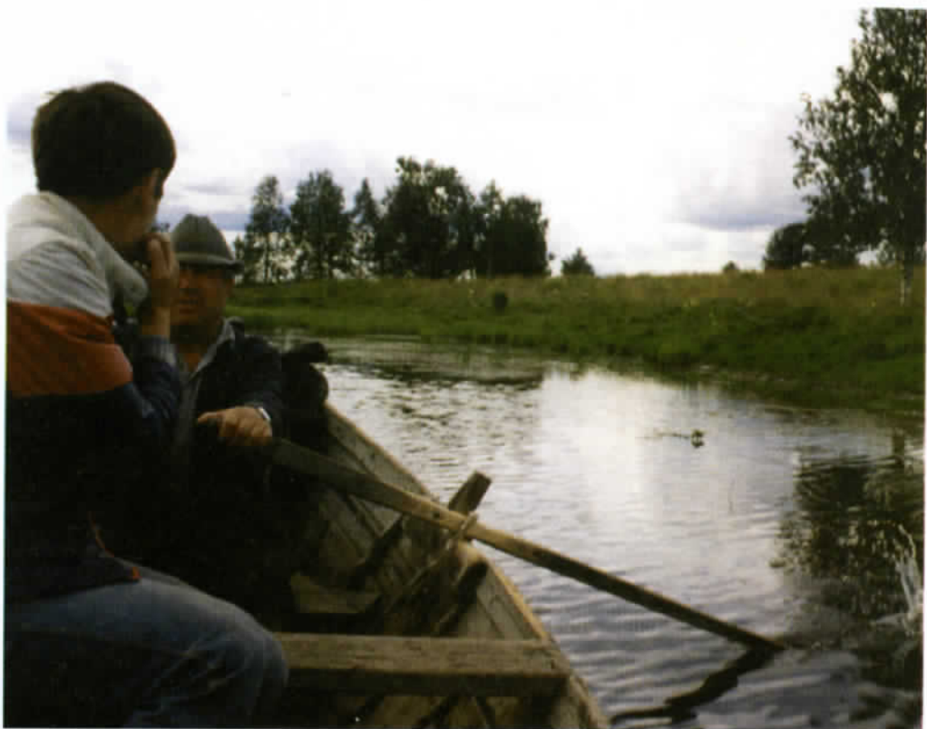
Salmen suu lähestyy. Oikealla puolella olivat mm. Petrin akan, Lesosen ja Savinin talot.