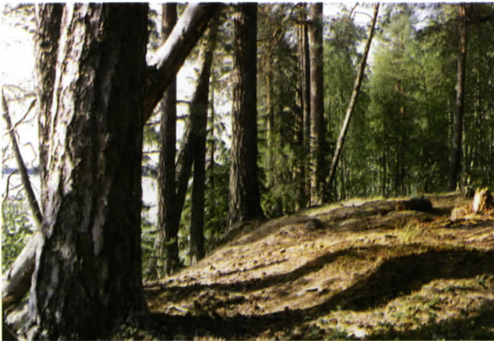
Paksut, kilpikaarnaiset petäjät vartioivat vainajien viimeistä leposijaa. Ristit ja kropsit ovat täällä jo ammuin maatuoneet.

Nuorisoliiton paikallinen solu oli järjestänyt monipuoli- sen ohjelman kulttuurivallan- kumouksen tunnusten pohjal- ta, ja punanurkan aktiivit ravintolan, joka oli laatuaan en- simmäinen kylässä. Tuloja siitä kertyi 42 ruplaa. – PK 2.11.1928.