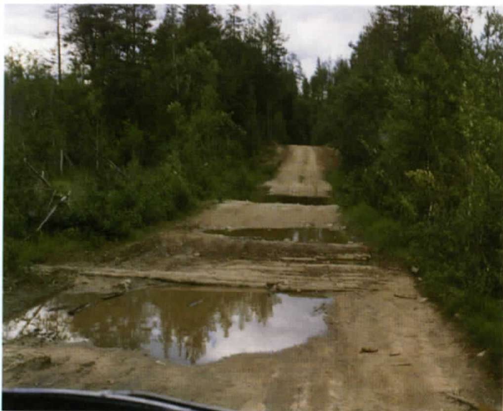
Hämeen kylään vievä tie on suora, mutta arvaamaton. Suopaikoissa vesi on kaivanut tien poikki syviä oja, joissa auton alusta on vaarassa.

Kylän rakennuksista ei ole jäljellä mitään. Ainoastaan voi löytää – jos tietää mistä etsiä – maatuneita kivijalan jäänteitä metsittyneiden peltojen liepeiltä. Järveltä katsoen löytää myös entisen kalmismaan paikan; siinä metsä nousee tuntuvasti ympäristöään korkeammalle. Ilman ikihonkia kalmismaata olisikin mahdoton löytää.