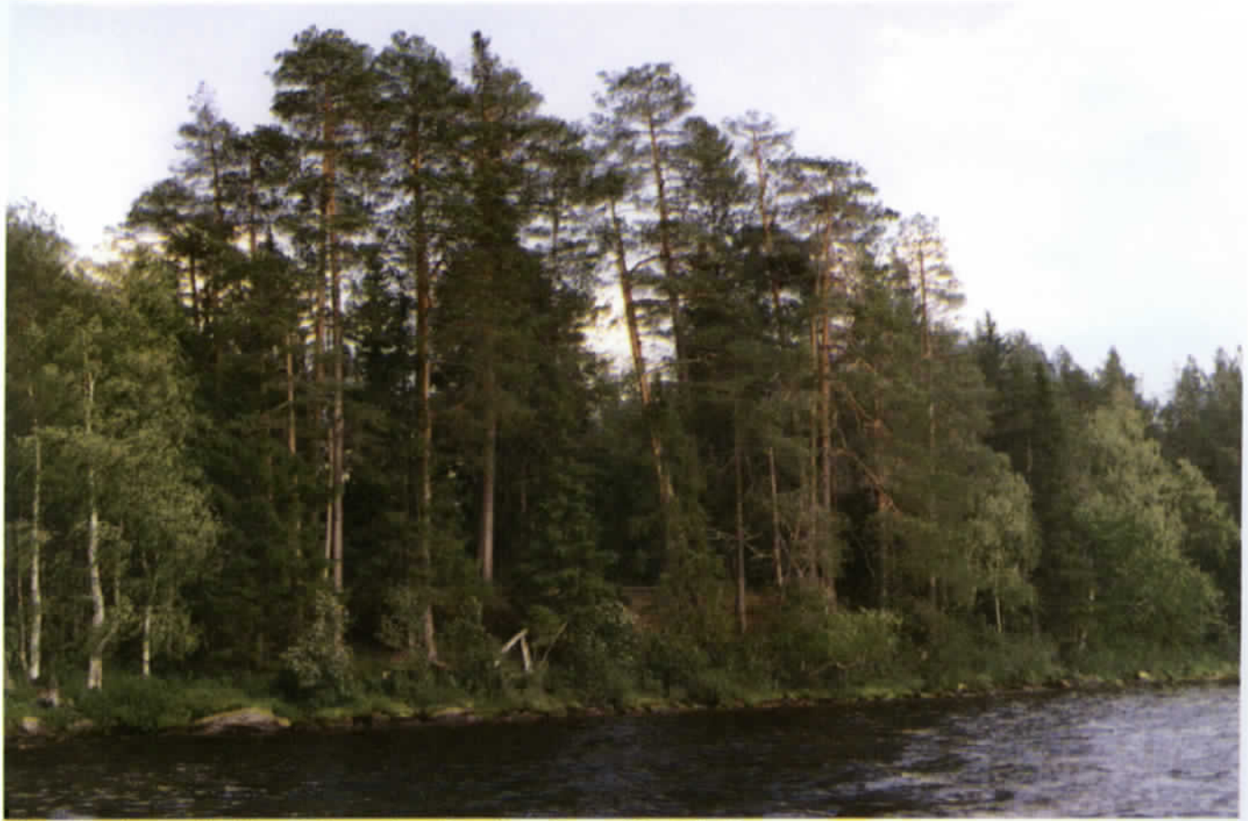
Kylän kalmismaan löytää parhaiten tarkastelemalla maisemaa järveltä päin.

nottu köysi, yksi oli soutajana ja yksi nuotanheittäjänä. Saa- liiksi saatiin lohta, siikaa ja hau- kea. Kotona kalat perattiin ja naisväki valmisti kalakukkoa ja keittoa.