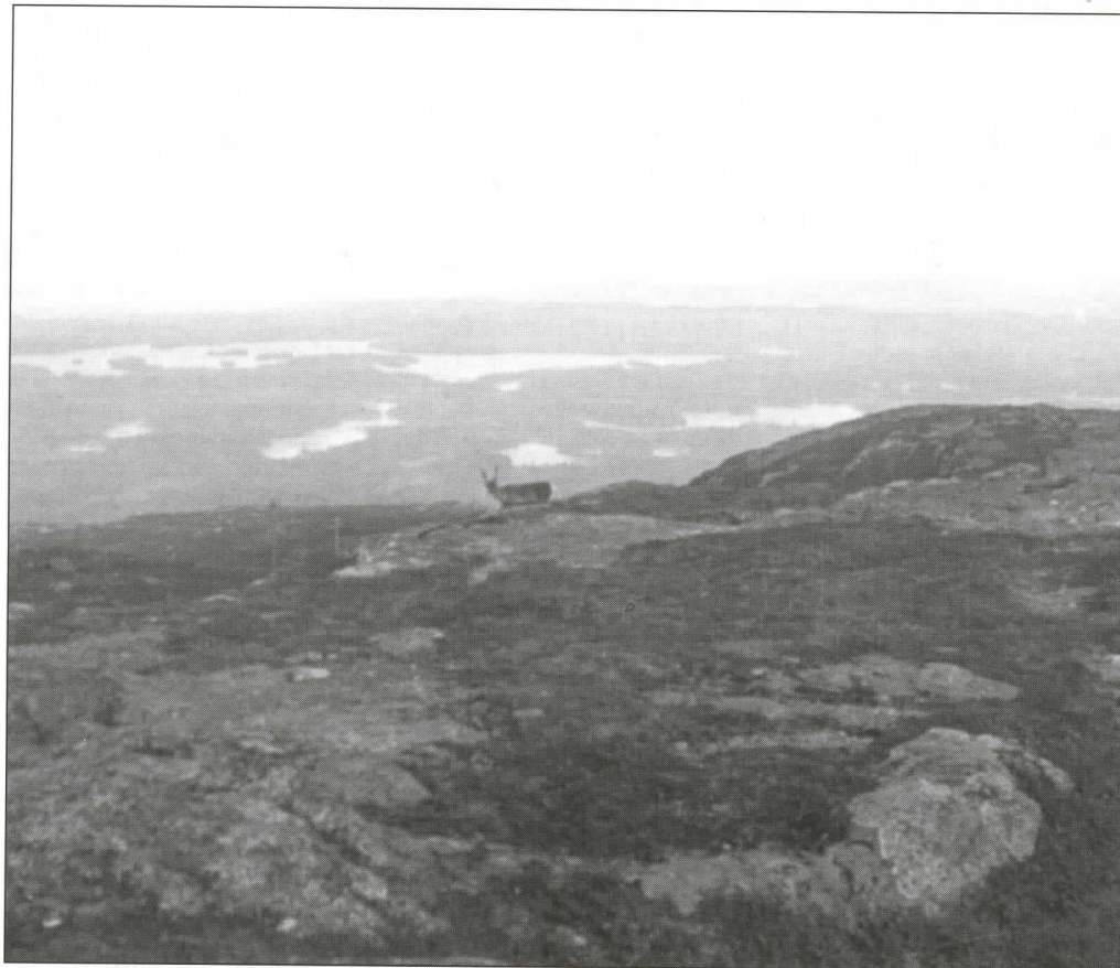
Nuorunen (576 m) on Karjalan korkein tunturi. Aikaan ennen sotia, kun tämä huippu kuului Suomelle, siellä kävi paljon retkeilijöitä - nyt tuskin porojakaan.

Arhangelskaja Eparhialna- ja Vedomosti 1909:4. Kirj. Leonid Shilov. Karjalan Heimolle suomentanut Nina Lavonen.