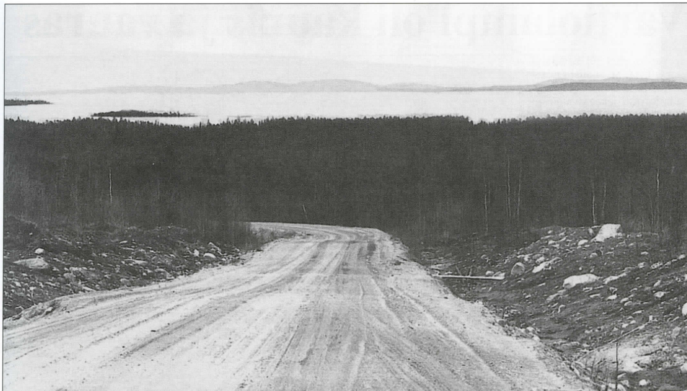
Pääjärven taajamasta Paanajärven kansallispuistoon vievän tien varrelta avautuu upeita näkymiä Pääjärven ulapoille; vasemmalle jää Laitasaari, taustalla ja oikealla mm. Lammakka, Petäjäsaari ja Maijasaari.