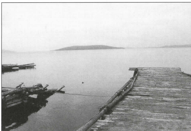
Niskan kylän satama järven koillisrannalla on nykyään hiljainen, keskellä näkyy Niskasaari.