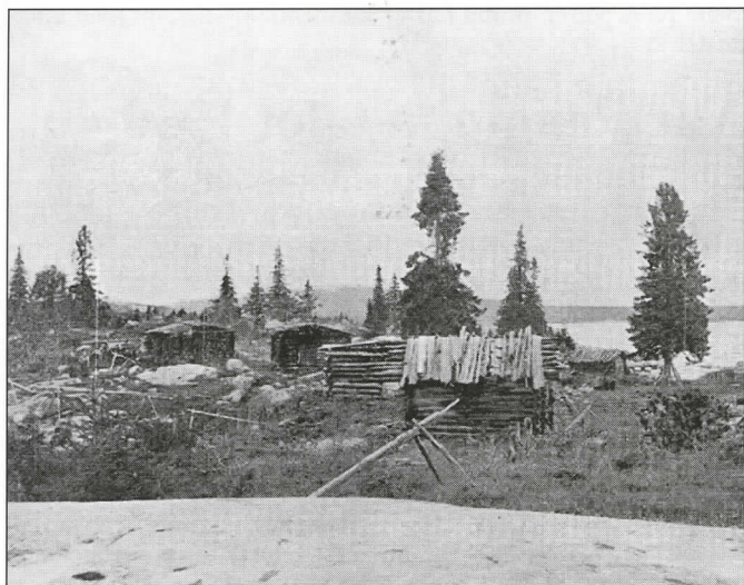
Nämä kalapirtit valokuvasi U. T. Sirelius 1911 Pääjärven Varpasaassa. Muutamia vuosia myöhemmin siellä kävi A. O. Väisänen. (kuva: KSS:n arkisto).