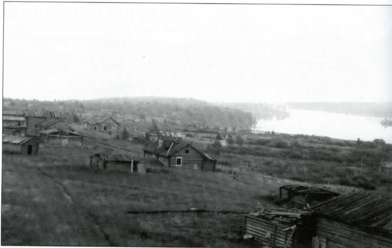
Laitasalmen kylää kansakoulun katolta; oikealla taempana näkyy mannermaa, edessä Piikslaksi ja salmi.