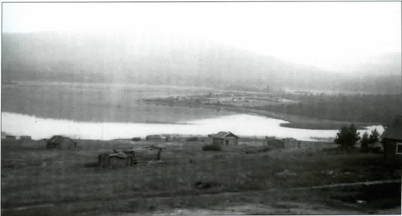
Laitasalmen kylänäkymä etelän puolelle. Taustalla kohoavat mantereapuoleiset vaarat, edessä salmi ja taaempänä Luikanto. (kuva: Pohjois-Pohjanmaan museon kokoelmat/Eino Jokinen 1942).

koulu, 15) Terola, 16) Romanan talo, 17) Muarie-akan talo, 18) Karppala, 19) Rotjon talo. – edelleen suuren kallion takana oli viisi taloa: 20) Jestusen talo, 21) Tommon talo, 22) Timon talo, 23) Ossipan talo, 24) Onttola (sillan korvassa).