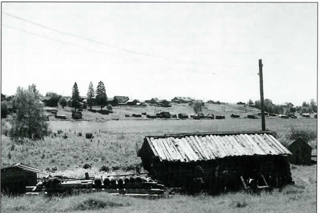
Tunkuan kylä 2001 Repolasta päin nähtynä.

Suomesta päin matka Tunkualle on pitkä ja vaivalloinen. On ajettava Vartiuk-